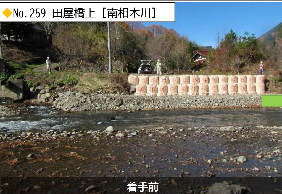
◆No. 259 田屋橋上 [南相木川]