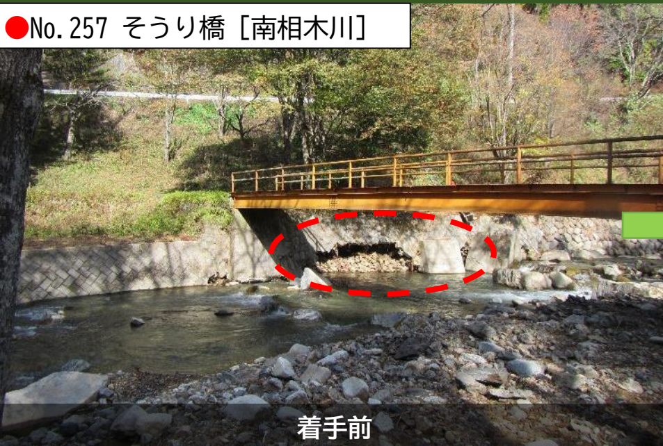
●No. 257 そうり橋 [南相木川]