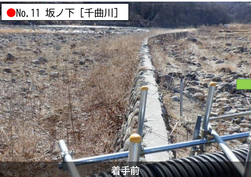
●No. 11 坂ノ下 [千曲川]