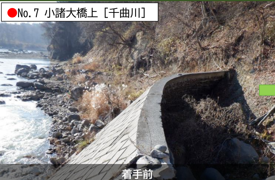
●No. 7 小諸大橋上 [千曲川]