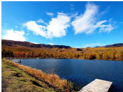
八千穂レイク (紅葉)