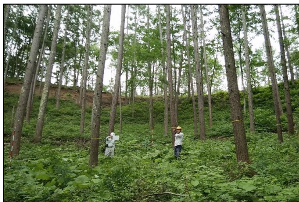
小海町小海七の軽井沢 間伐