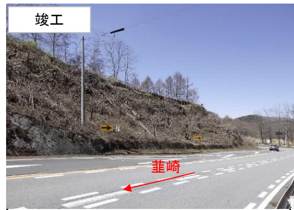
(令和2年度 施工箇所 国道141号 南牧村 市場坂)