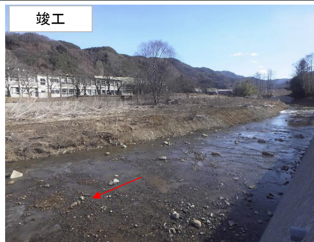
(令和2年度 施工箇所 一級河川雨川 佐久市 五稜郭・田口小学校付近)