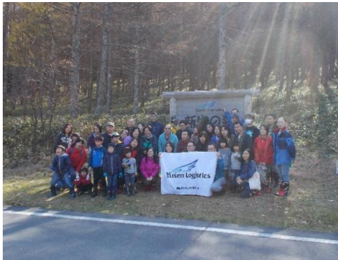
企業（社員）による森林整備体験（立科町）