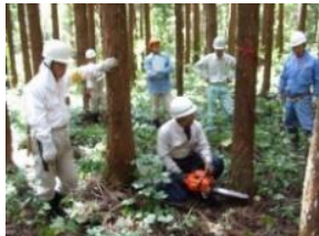
住民協働の森林整備