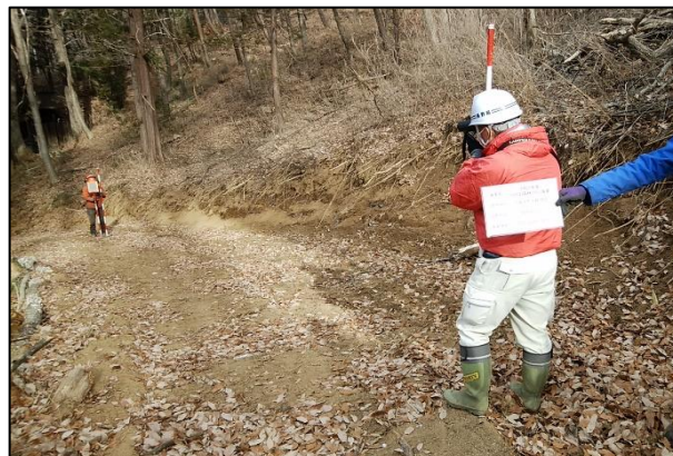
佐久市入沢 森林作業道開設