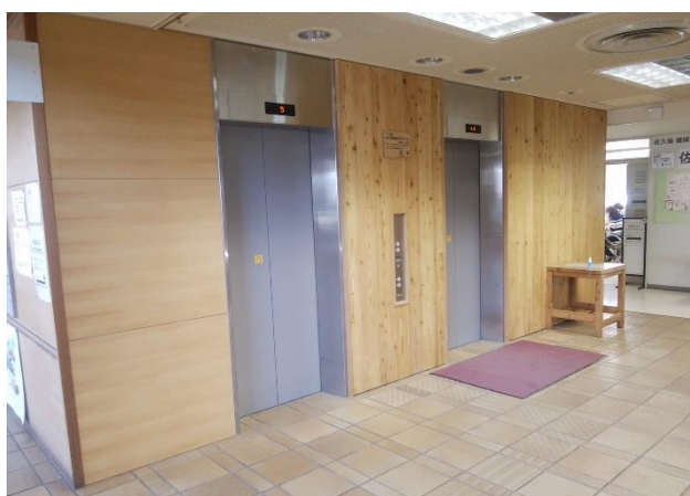
1Fエレベーター入り口