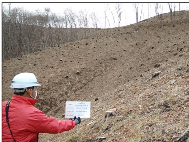
佐久穂町穂積 特殊地拵え(林野火災跡地)