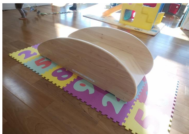
子育て支援センターに設置された滑り台