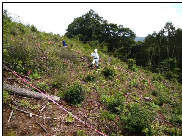
小海町千代里 植栽