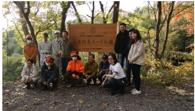
調印式後の記念植樹（小諸市）