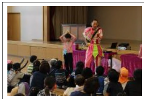
【なおやマンによるエンターテインメントショー】