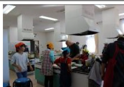
【模擬こども食堂にて調理体験】