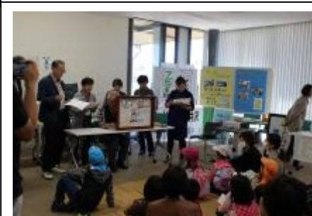
【悩み相談や学習支援のブース設置】