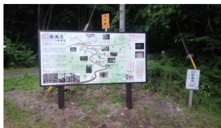
【 看板設置 】