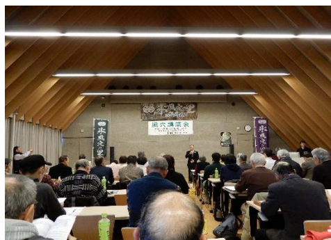
【 講演会状況 】