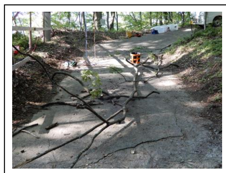
【 枯れ枝除去状況 】