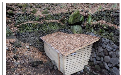
【 貯蔵小屋新設 】