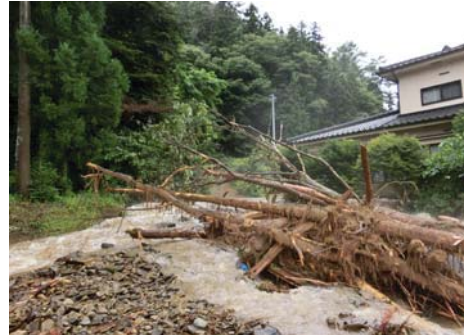
③ 松本市 水沢(上海渡)(土石流)