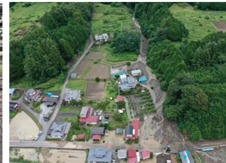
⑤ 辰野町 小野(土石流)