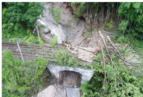
① 木曽郡上松町 下川原(土石流)