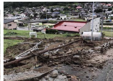
④ 岡谷市 大久保(土石流)