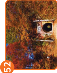
旧田鉄橋 / 井線跡線敷 安曇野市