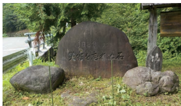
「自然災害伝承碑」の例(木曾町「災害を忘れぬ石」)