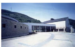
長野県立歴史館外観

常設展示室は原始から現代までたどれる展示で、ナウマンゾウ、縄文のムラ、鎌倉時代の善光寺門前、江戸前期の農家、明治初期の製糸工場など、時代ごとの人びとの生活を体験できるようになっていて、臨場感あふれる実物大の展示が楽しめます。