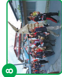
大原の水神祭 中野市