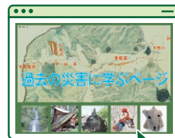
Webサイト「過去の災害に学ぶページ」

長野県立歴史館と長野県建設部砂防課では、共同の取り組みとして、歴史館所蔵の「長野県明治初期の村絵図」の一部を活用した「過去の災害に学ぶページ」を開発しています。