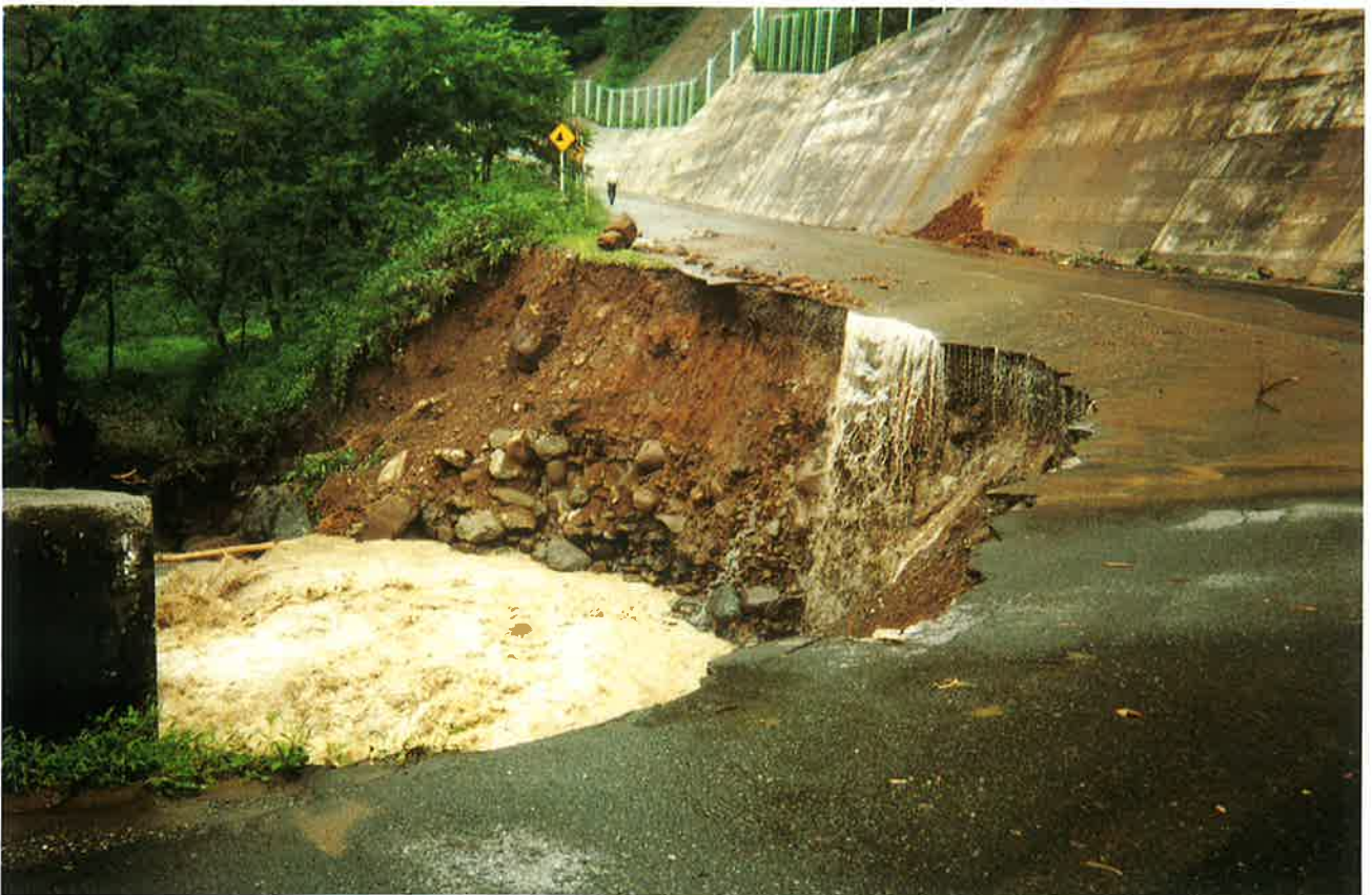
親沢川にえぐり取られた県道