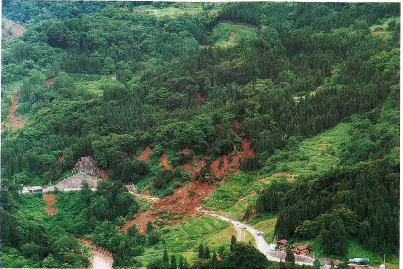
地すべりで県道封鎖