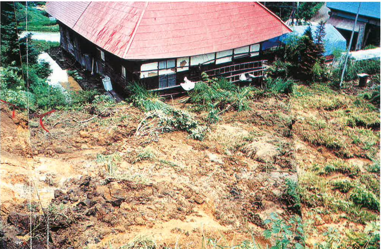
人家に押し寄せる地すべり