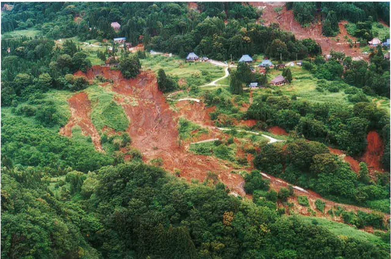
豪雨で地すべり再活動