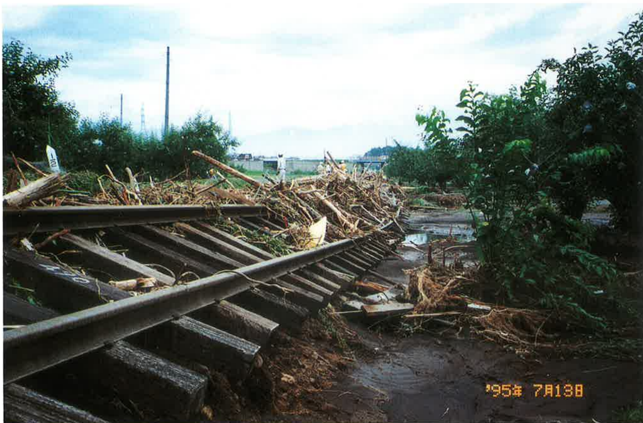
浸水で基盤を流失した軌道