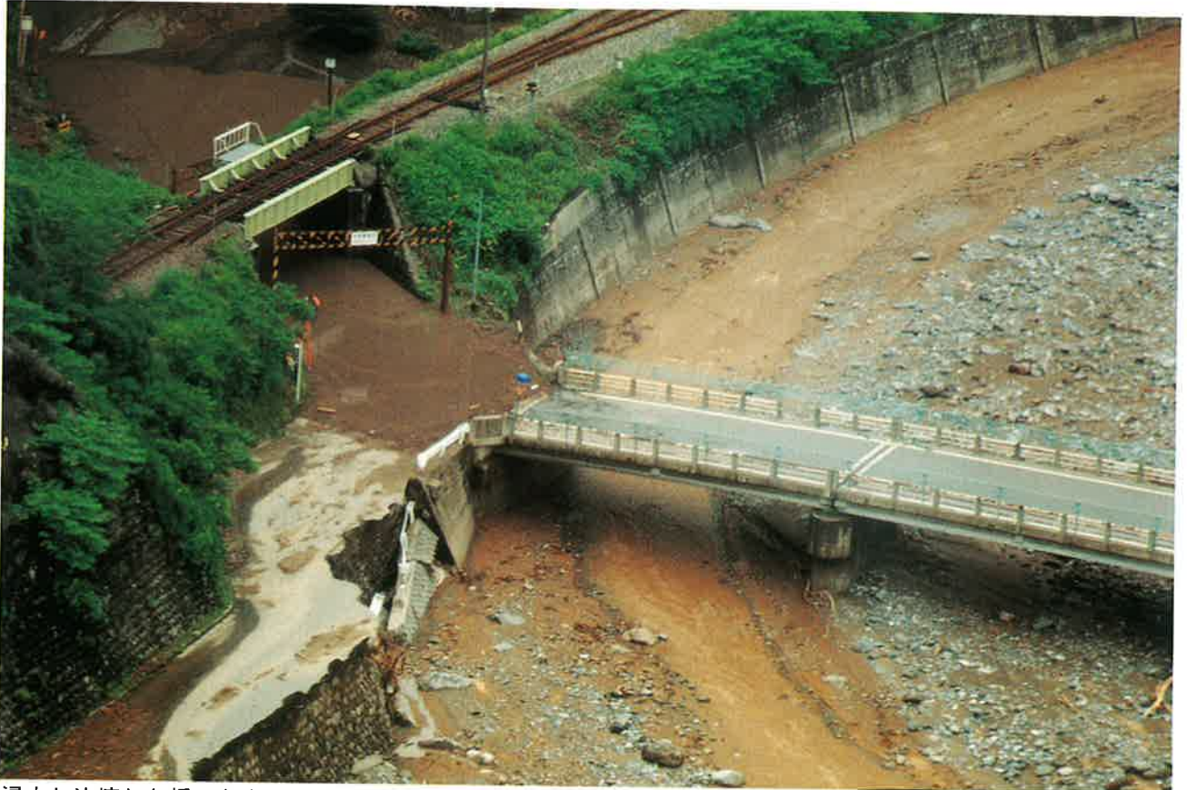
浸水し決壊した橋のたもと