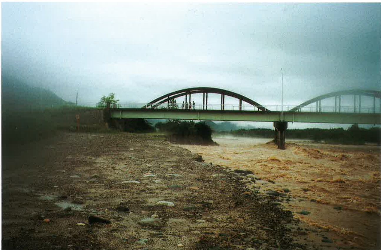
橋の根元に迫る濁流