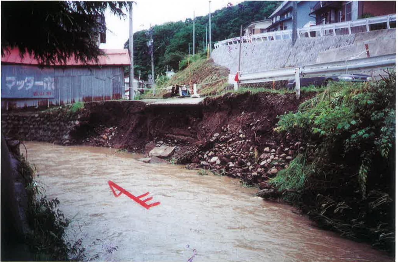
住宅街で河岸決壊