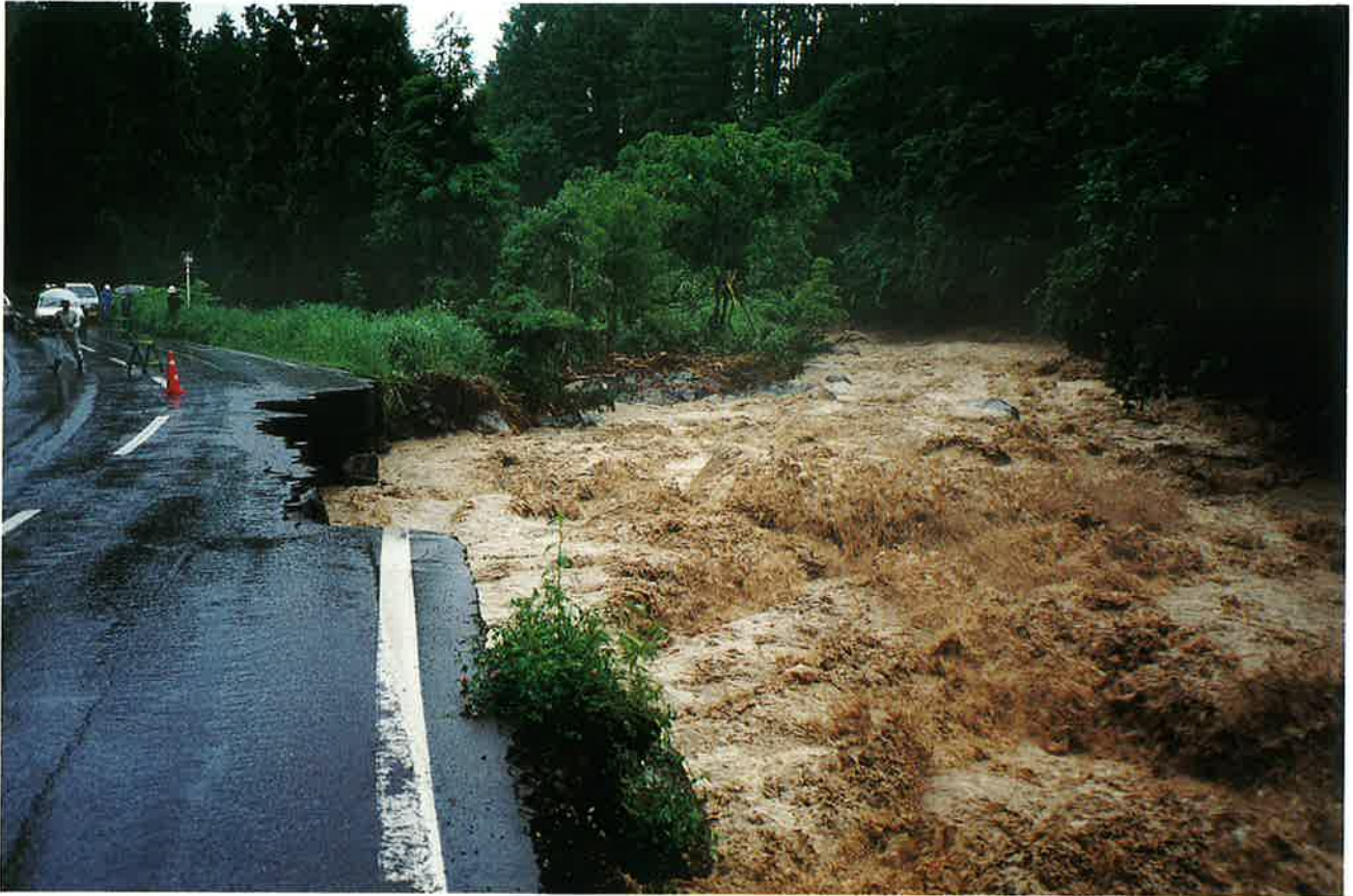
楠川にえぐり取られた県道