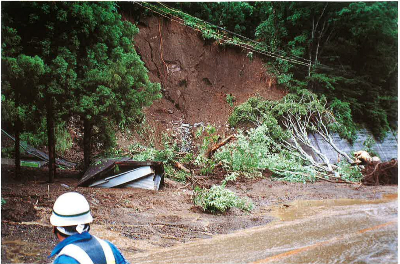
道路沿いの斜面が崩落