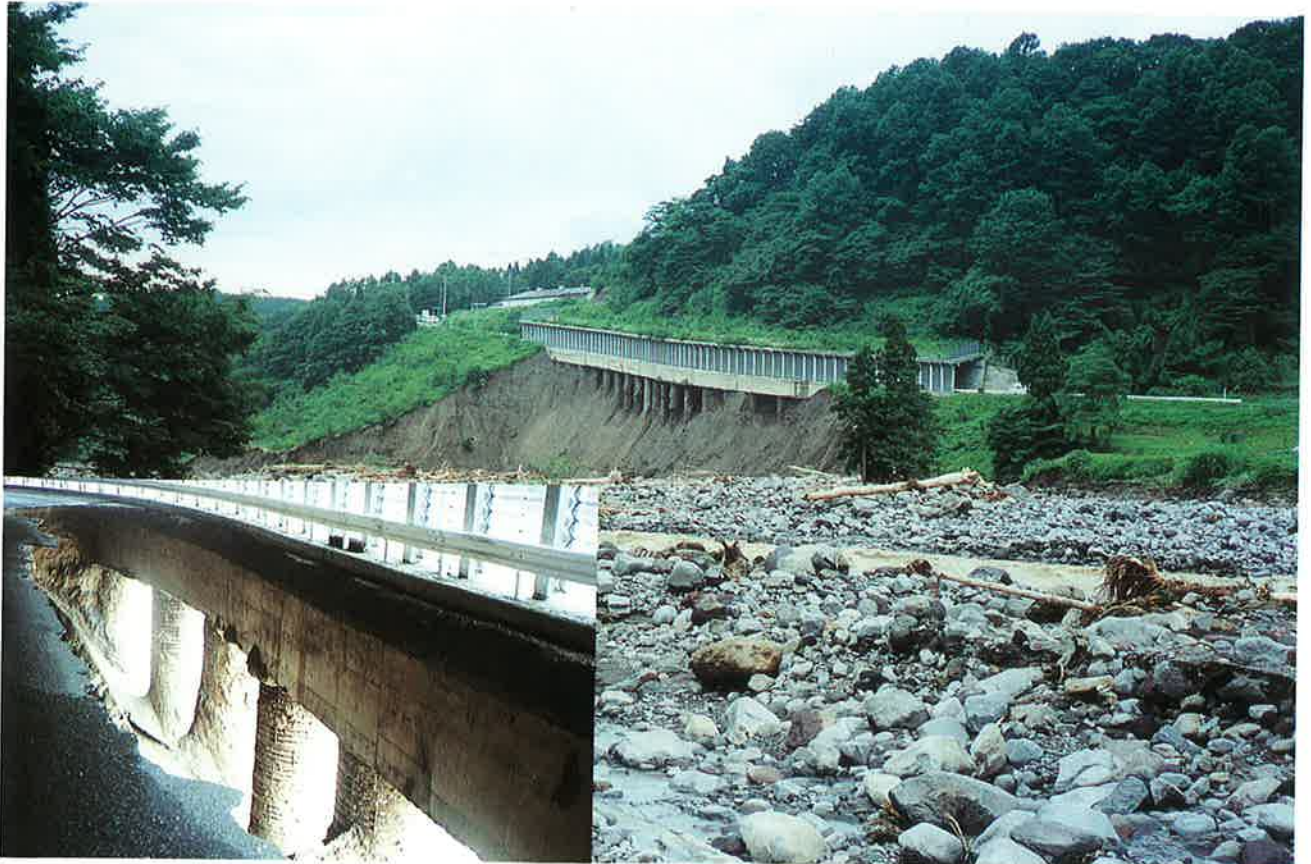
関川に洗掘された洞門の基礎