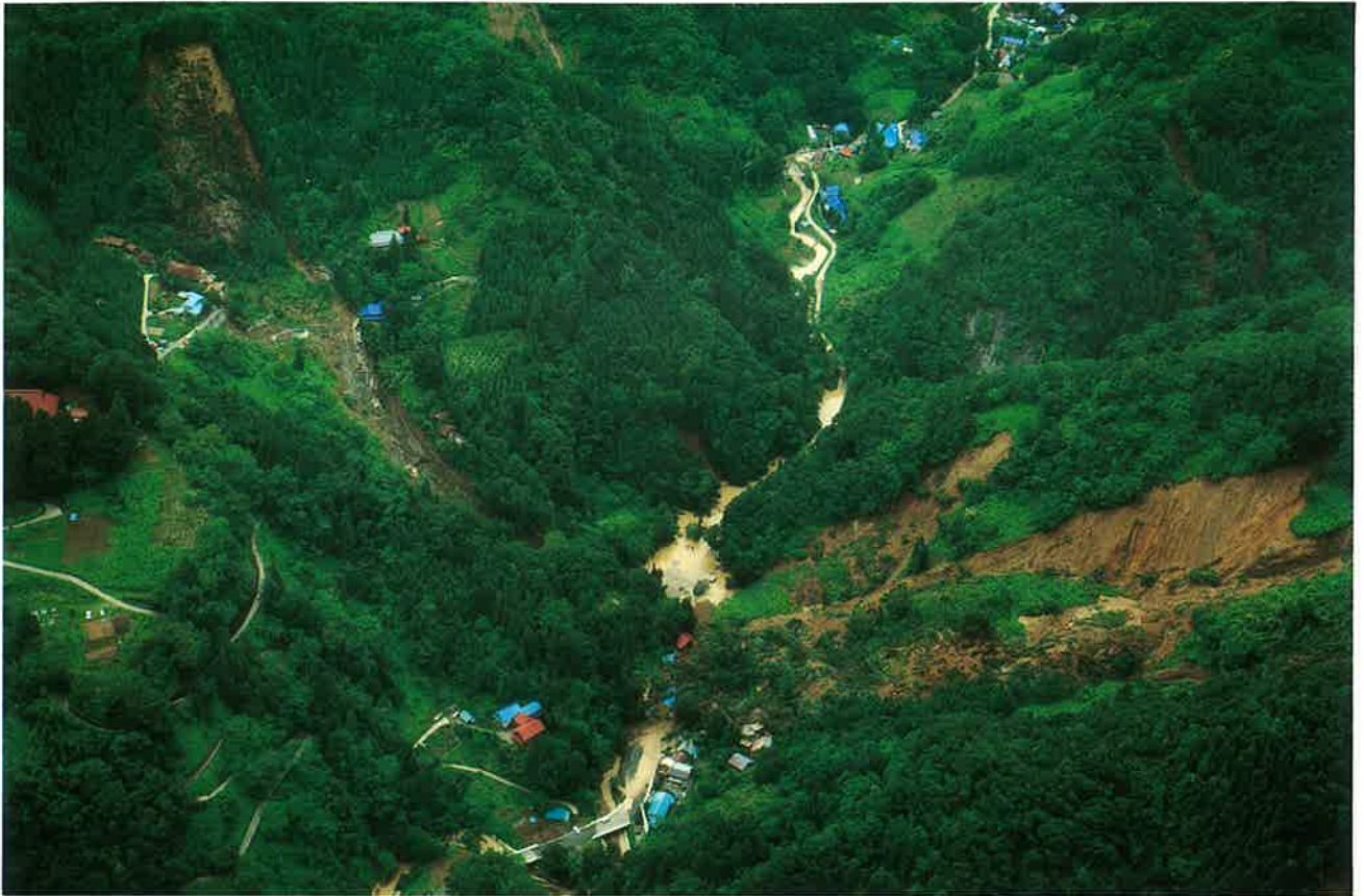
土尻川をせき止めた地すべり