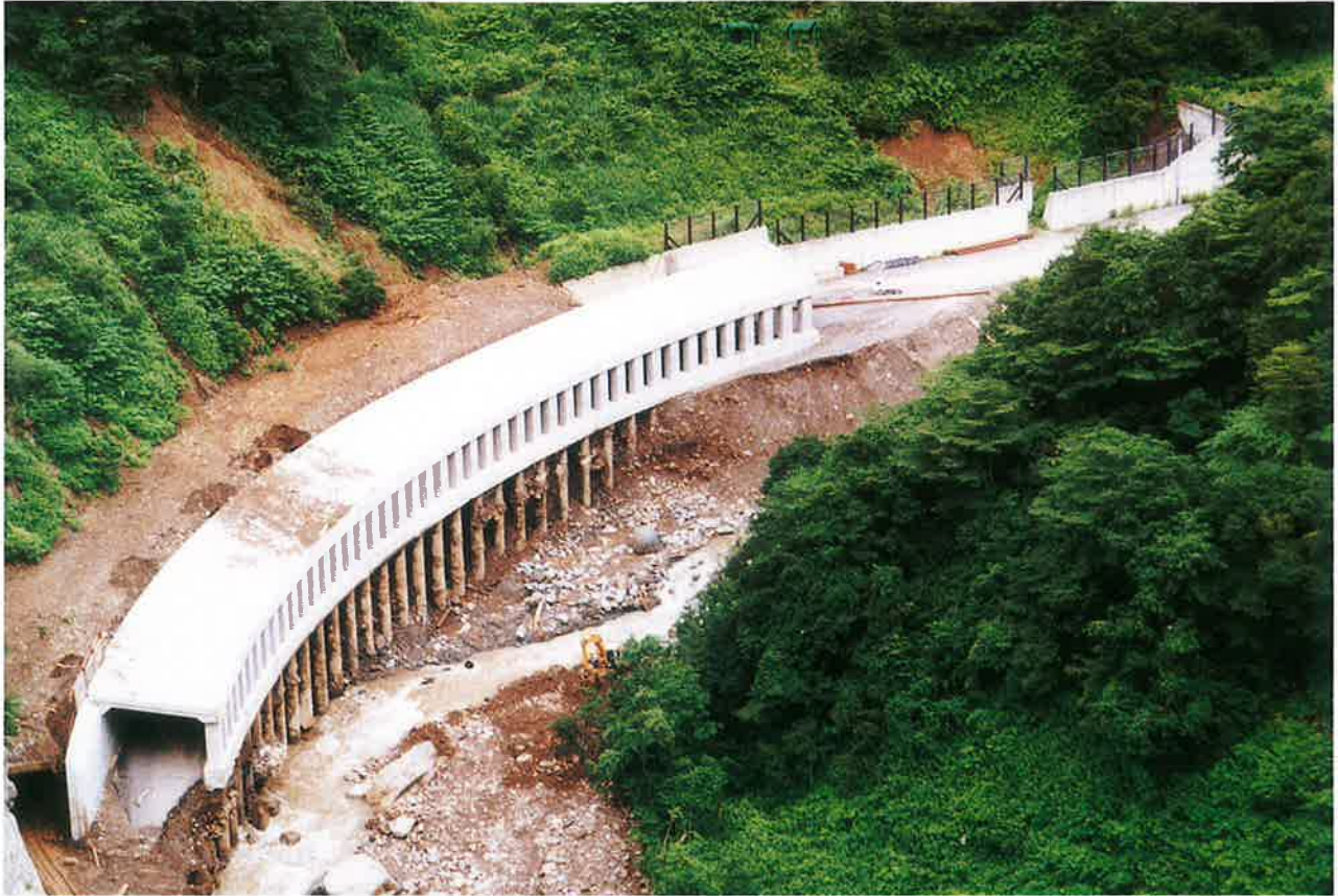
中谷川に洗掘された洞門の基礎