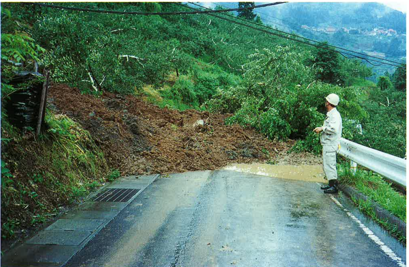
地すべりが県道封鎖