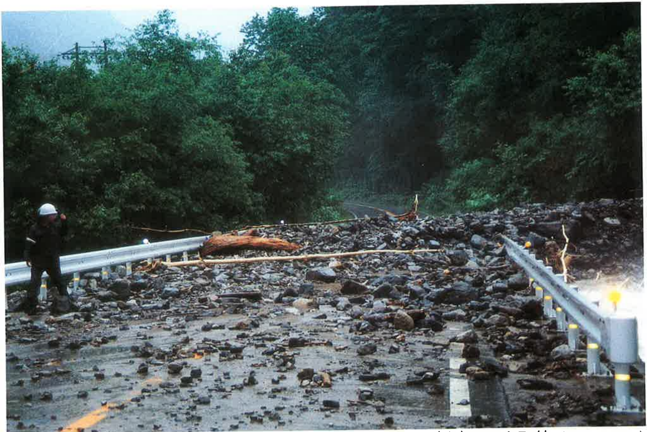
沢からの土砂で県道封鎖