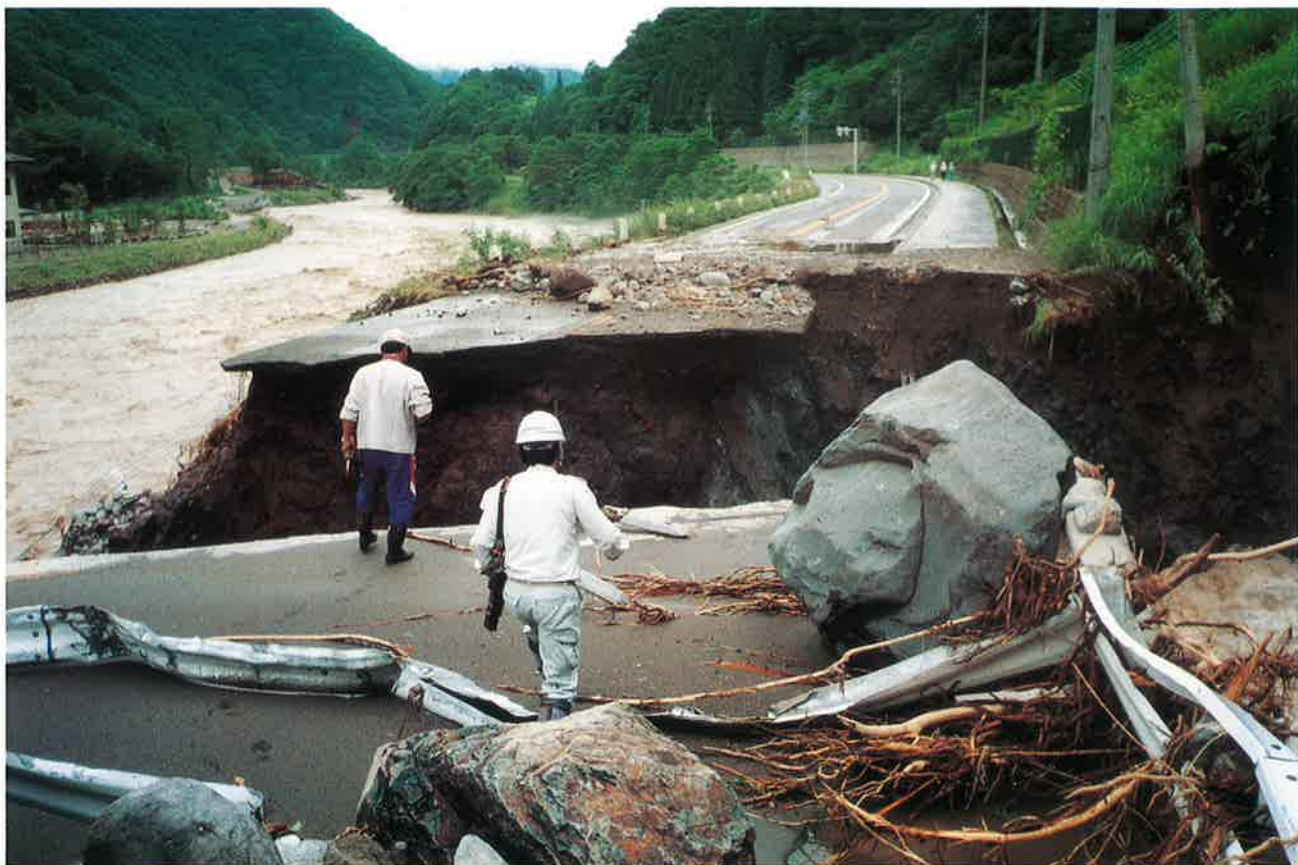
土石流が道路を切断