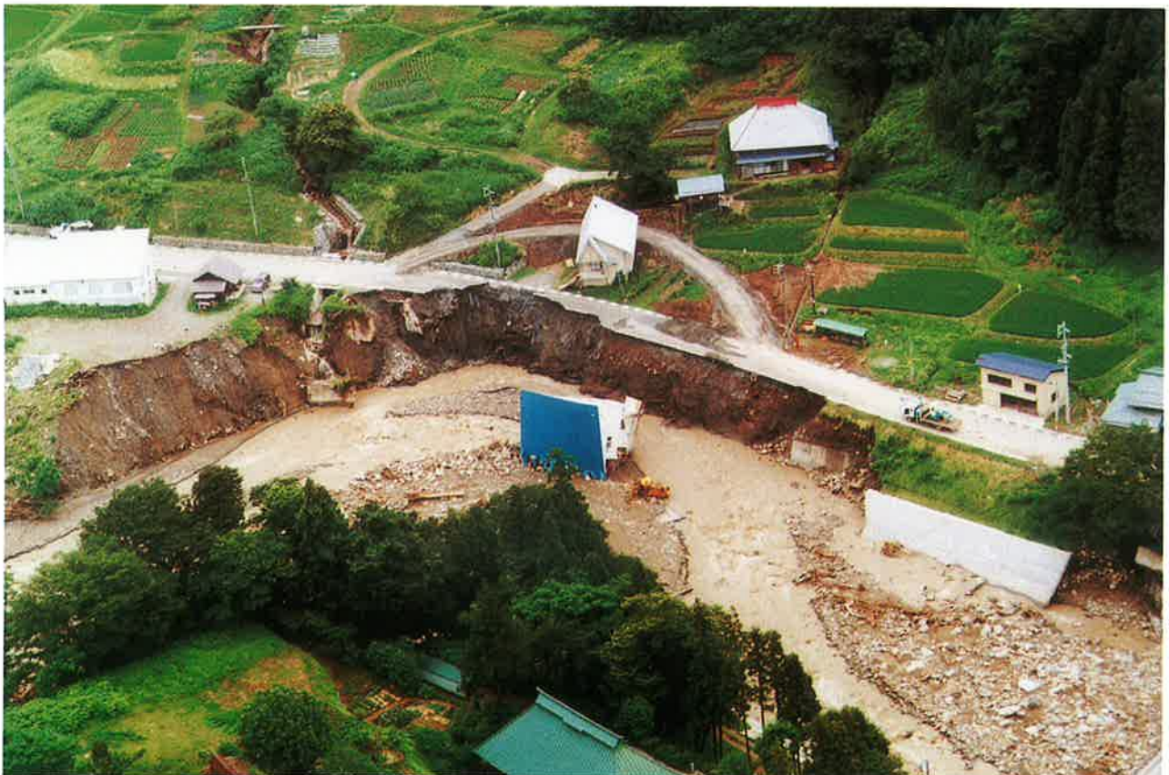
中谷川にえぐり取られた県道