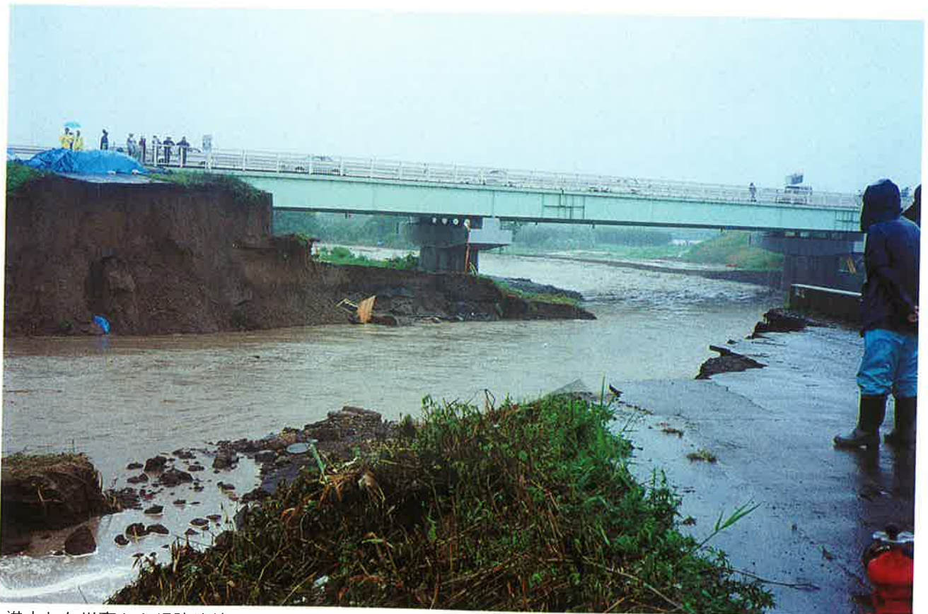
湛水した川裏から堤防決壊