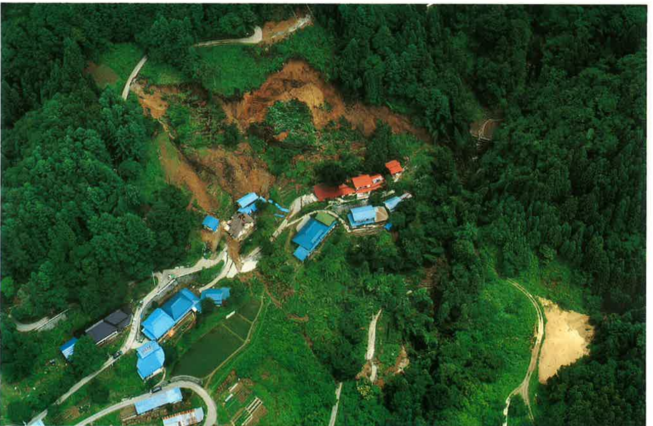
集落を襲った地すべり