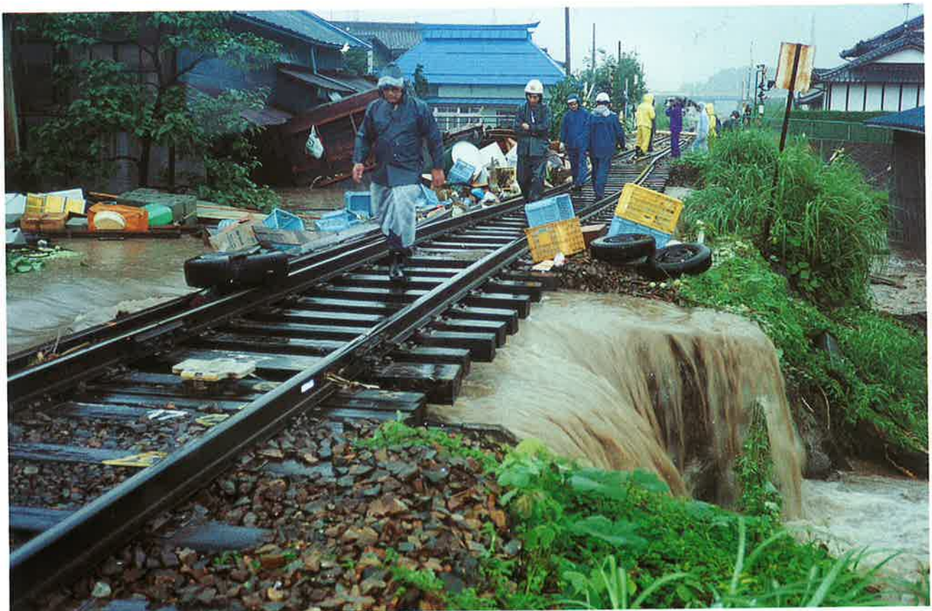
基盤をさらわれ宙に浮く軌道