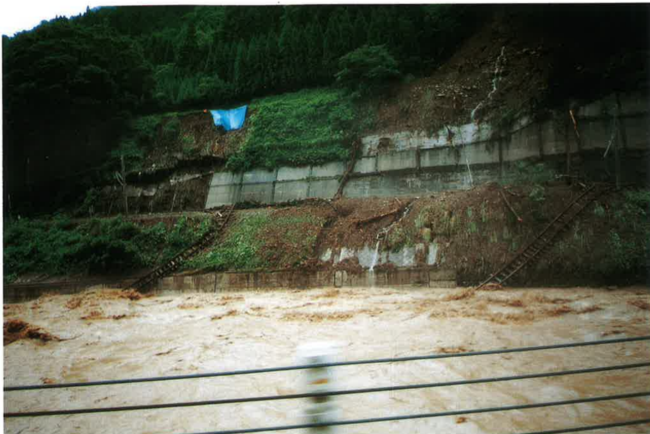
土砂崩落で切断された軌道