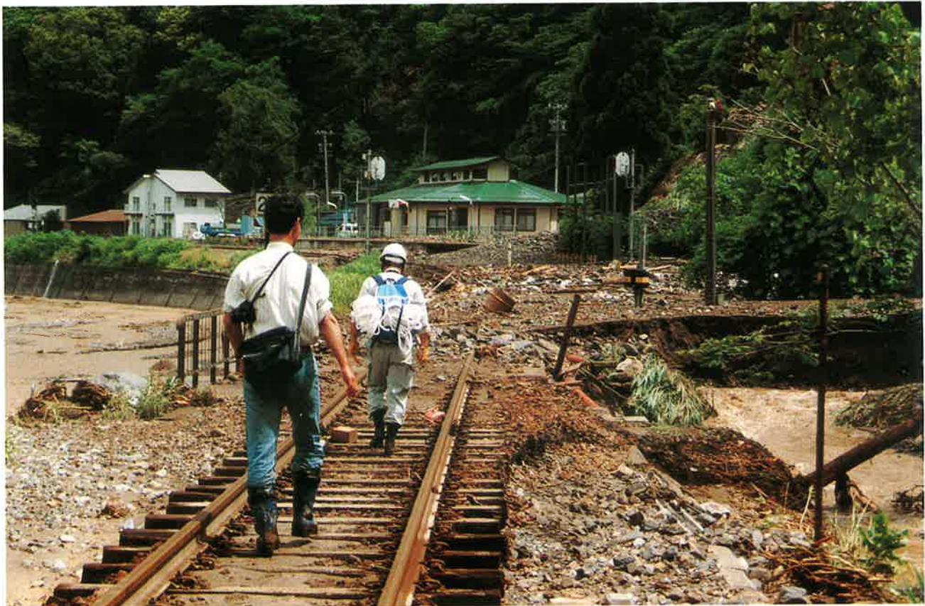
土石流に襲われ壊滅状態