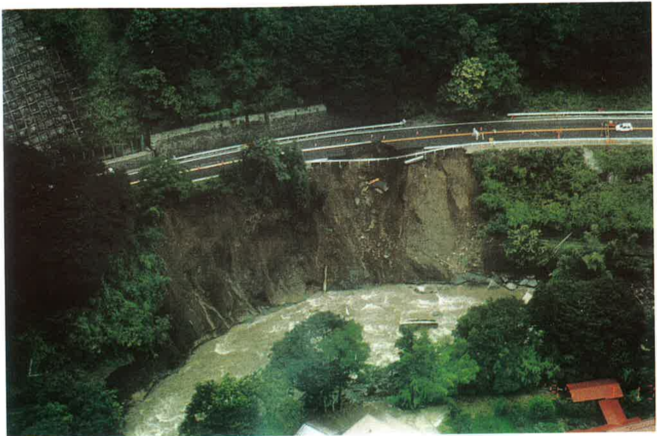
鳥居川に洗掘され崩落