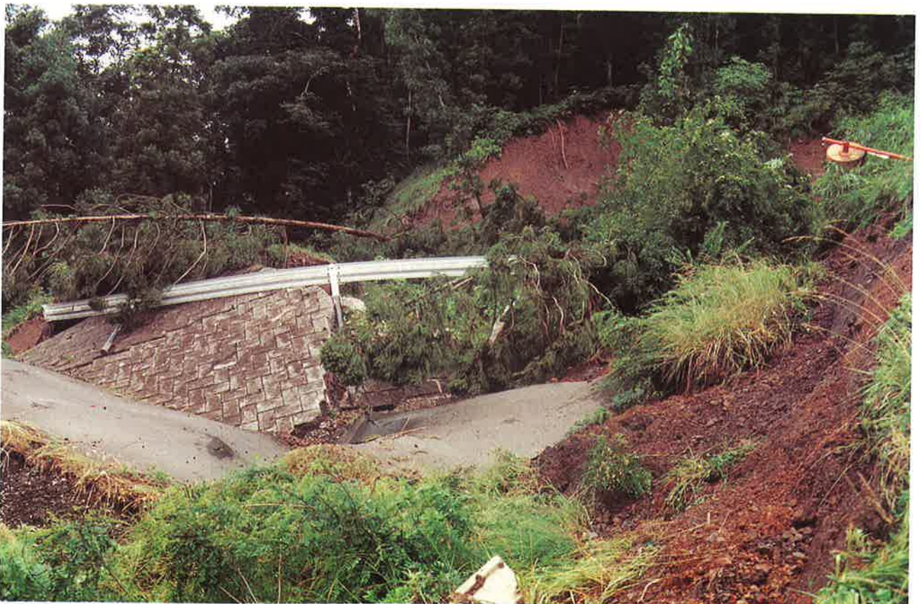
地すべりで県道崩壊