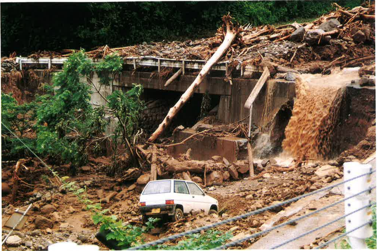
光明沢の土石流で道路封鎖