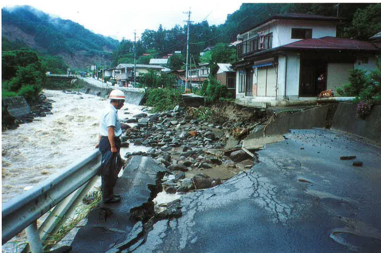
人家の基礎まで洗掘