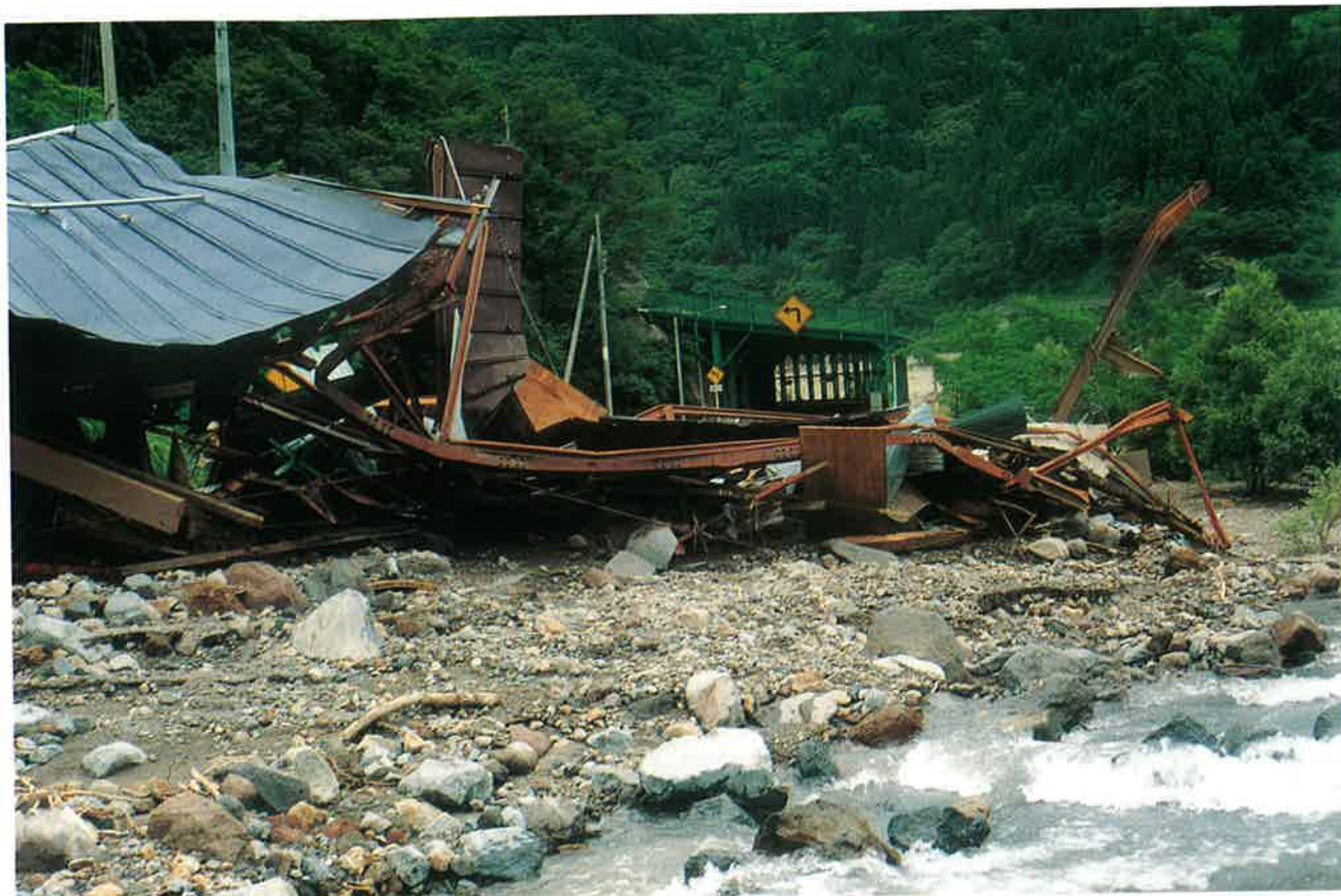
土石流で道路封鎖