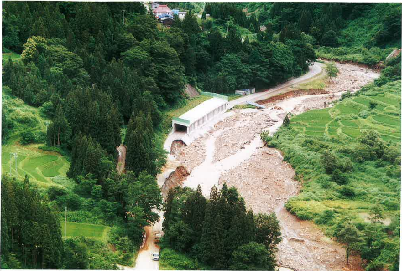
沿川各所に残る爪痕