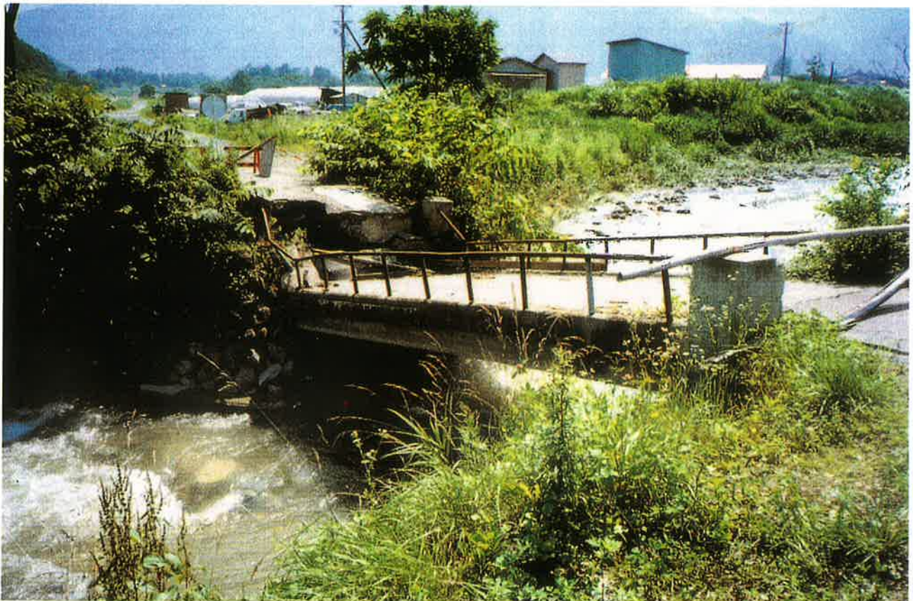
氾濫により村道橋が陥落