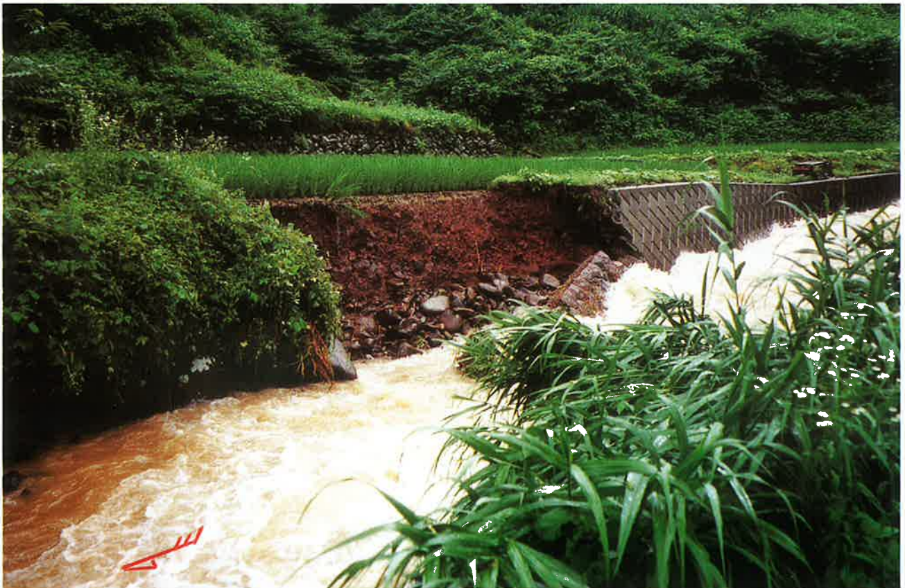
河岸を決壊させた濁流