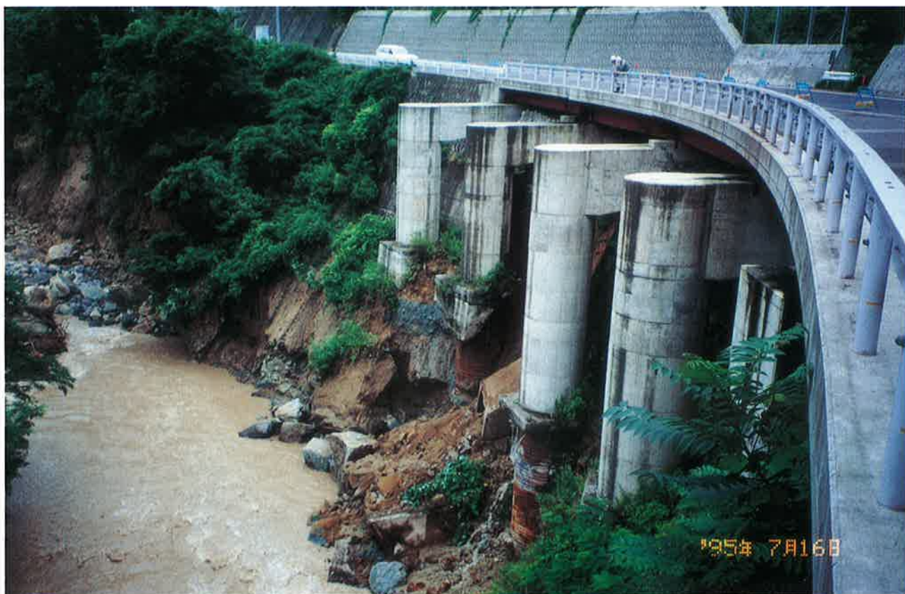
橋脚の基礎杭が露出