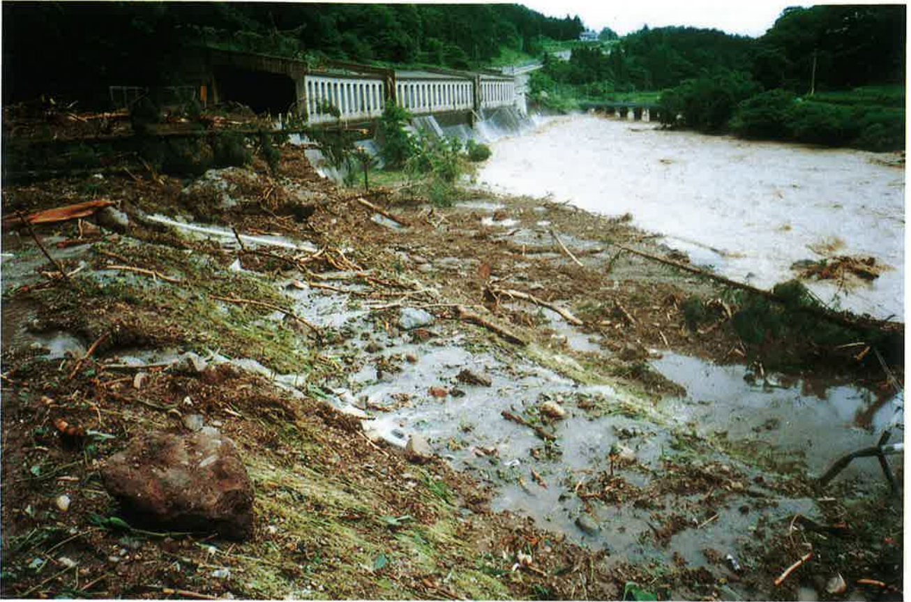
土砂崩落で道路封鎖