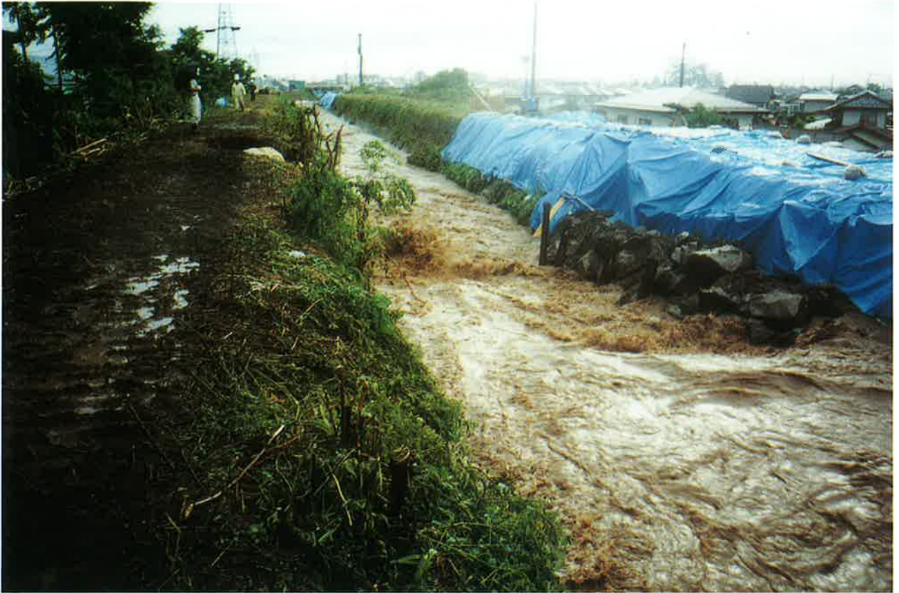
天井川決壊の危機