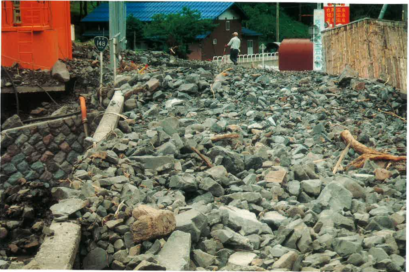
湯原沢の土石流に埋めつくされた橋