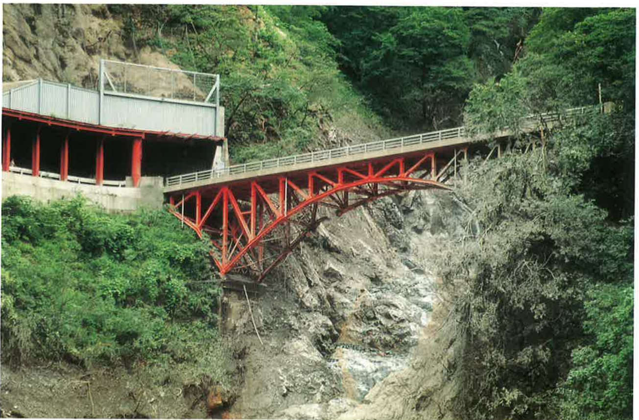
土石流で橋の部材が破断