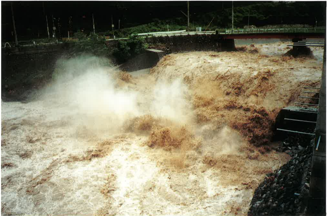
石や岩が火花を散らす濁流