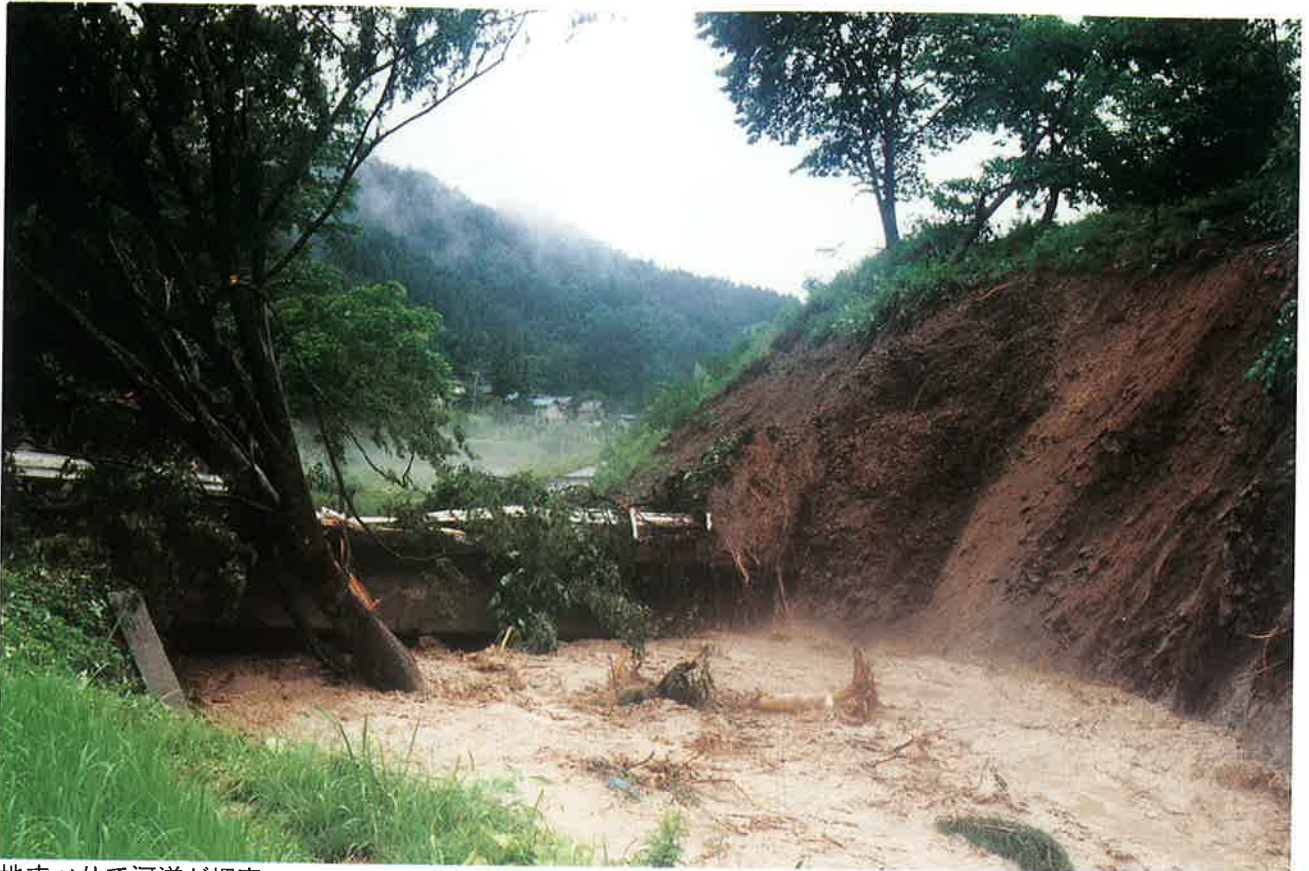
地すべりで河道が埋塞