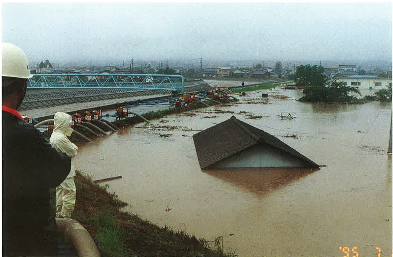
排水作業もむなしく水位が上昇