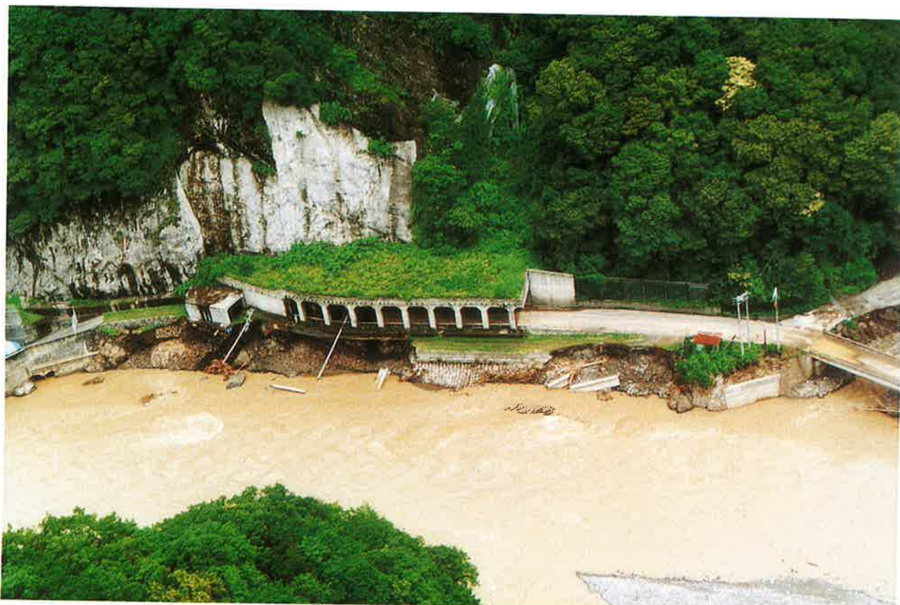
足元を削られた平倉洞門