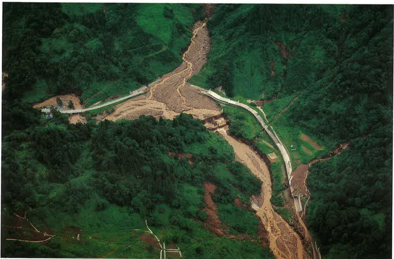
土石流が県道封鎖