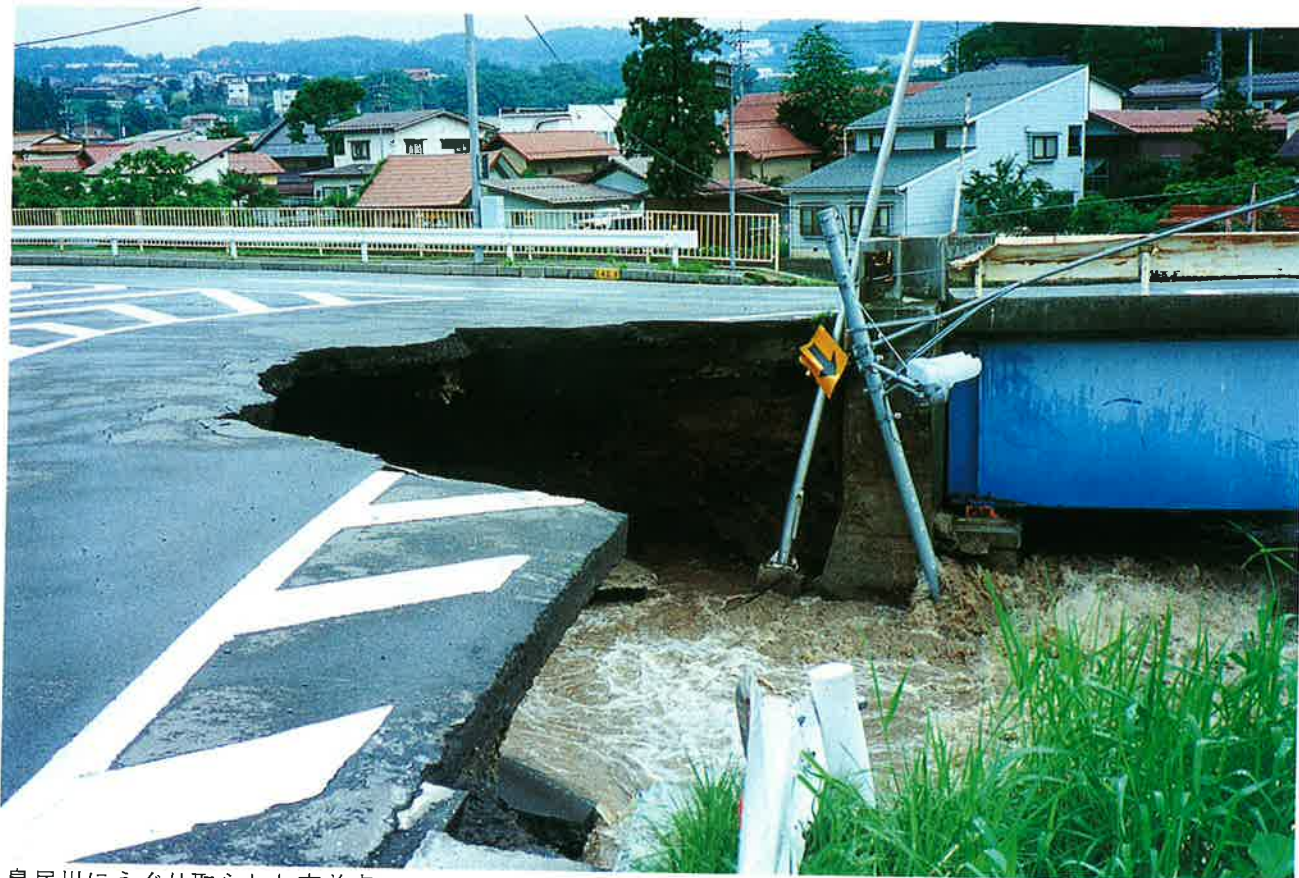
鳥居川にえぐり取られた交差点