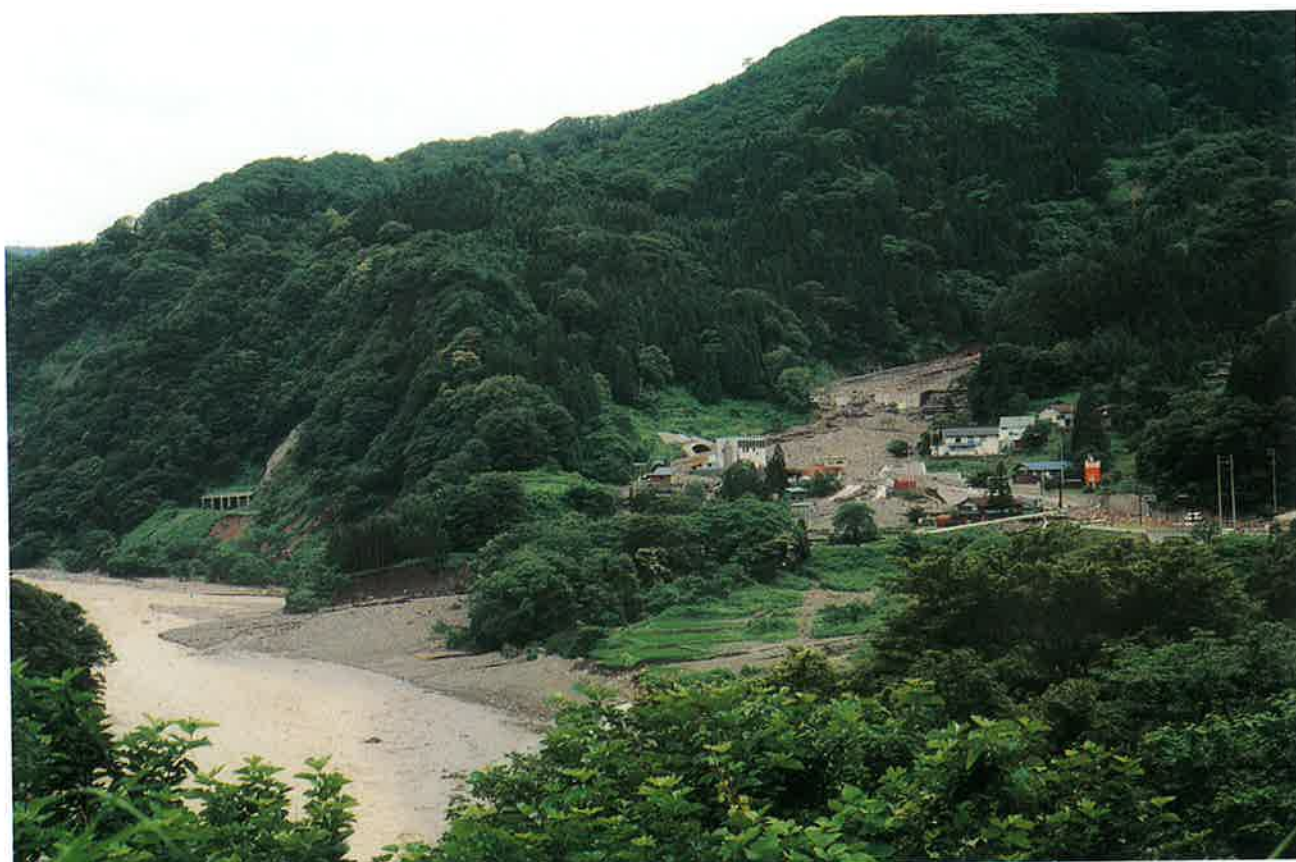
国道を乗り越え川へ押し出した土石流