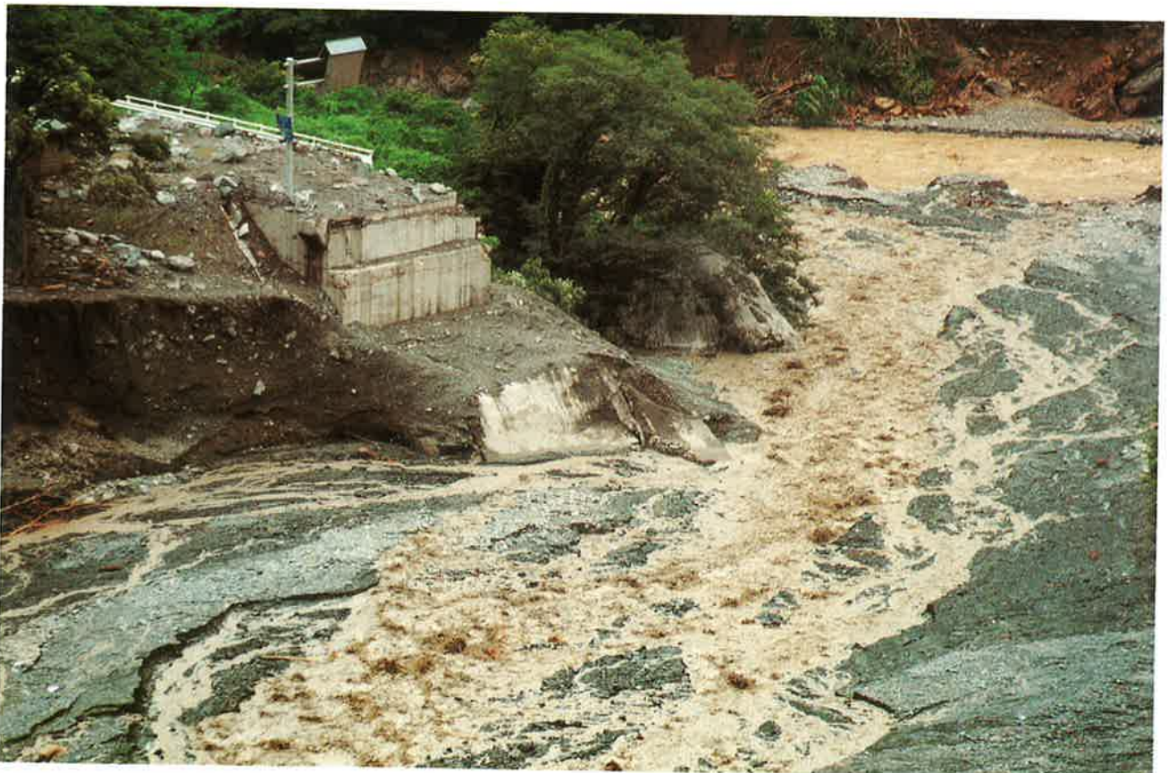
国道148号・新国界橋を流し去った土石流