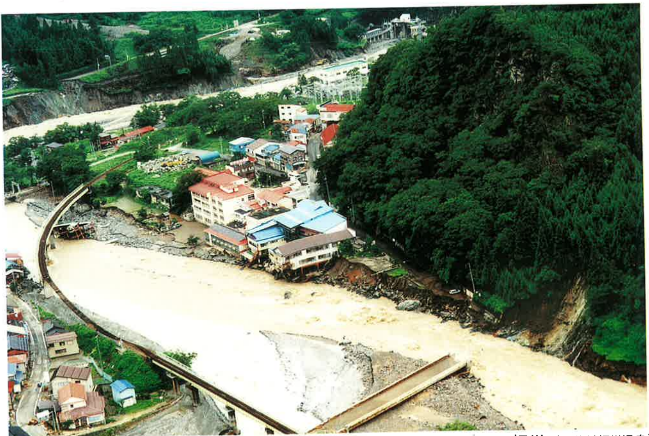
橋を断ち切られて集落は孤立