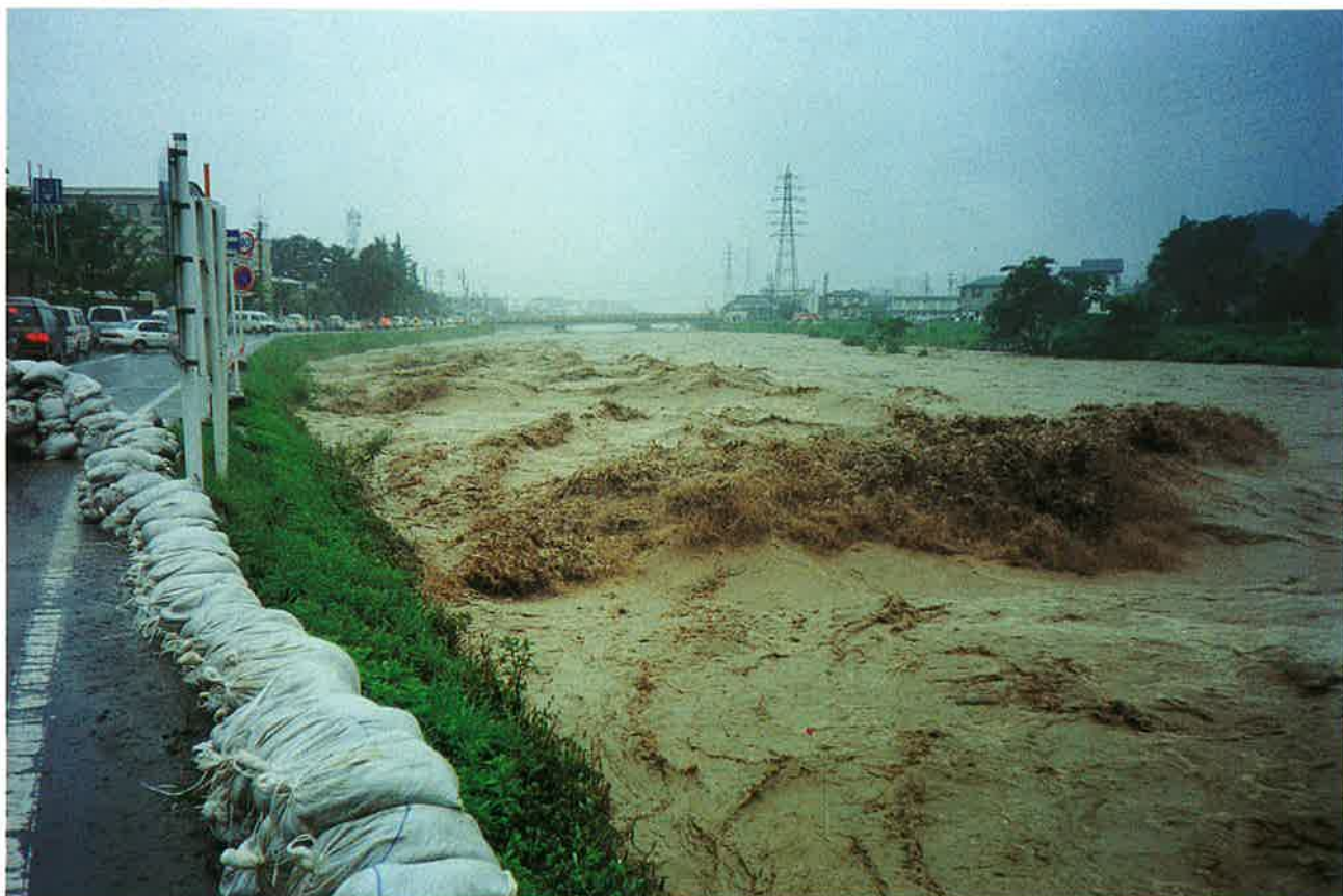
市街地を脅かす濁流