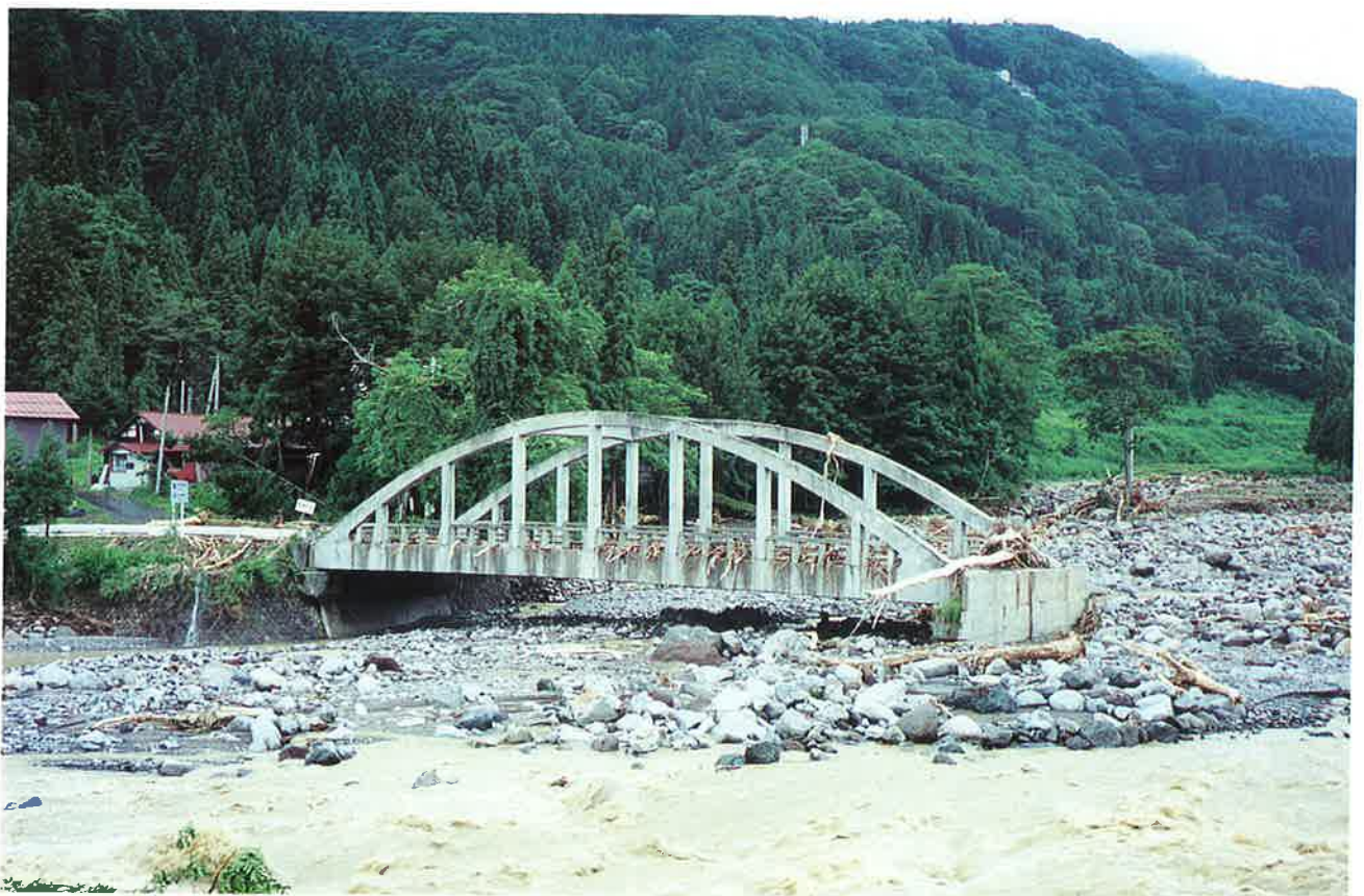
道路をさらわれ取り残された橋