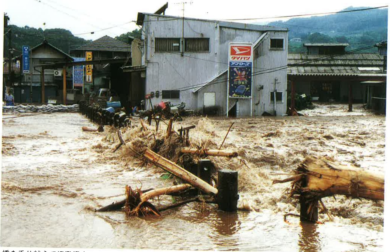
橋を乗り越えて氾濫浸水