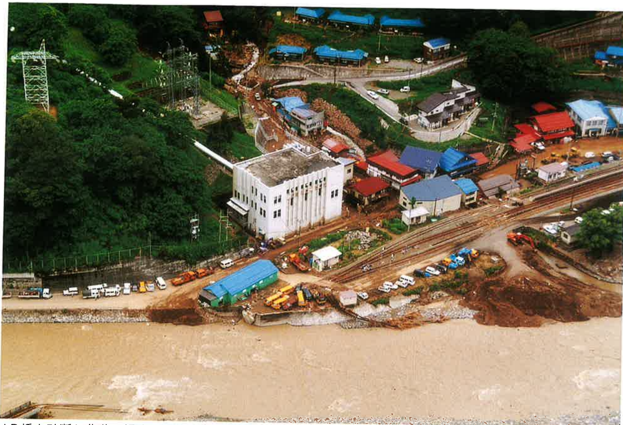
JR橋を破断し集落は浸水