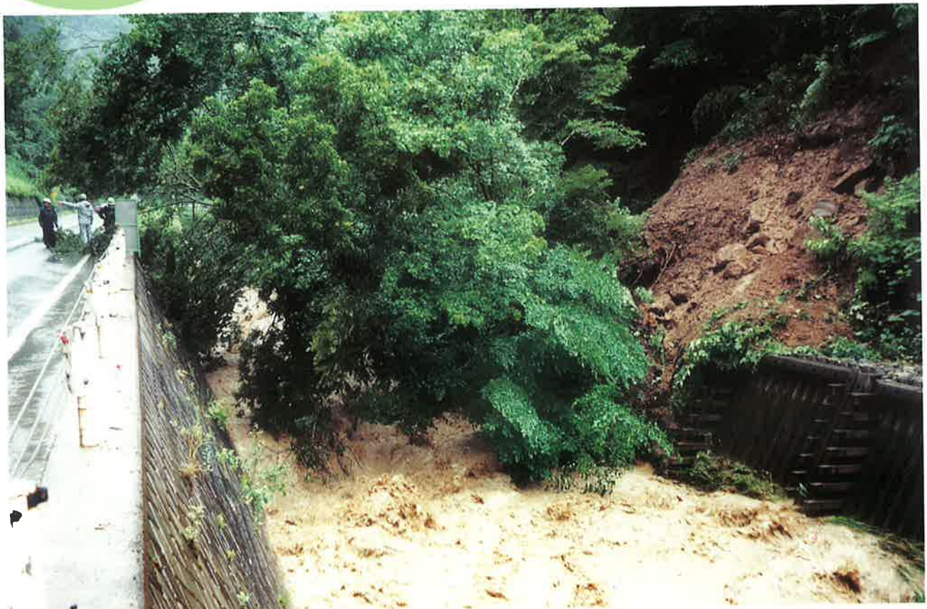
川沿いの斜面が崩落