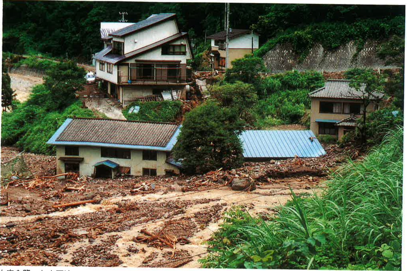
人家を襲った土石流