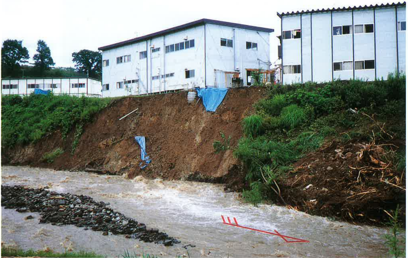
河岸が大きく崩落