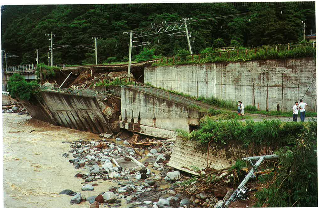
関川の洗掘により軌道崩壊