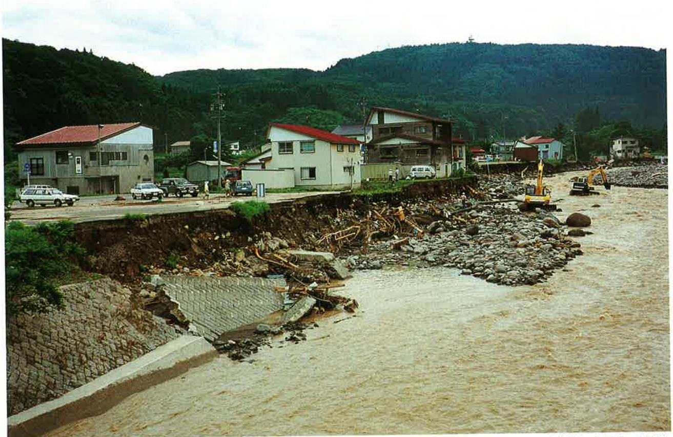
集落の際まで決壊