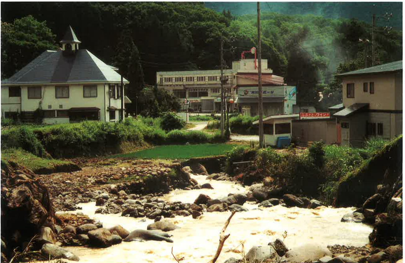
土石流で荒れた集落