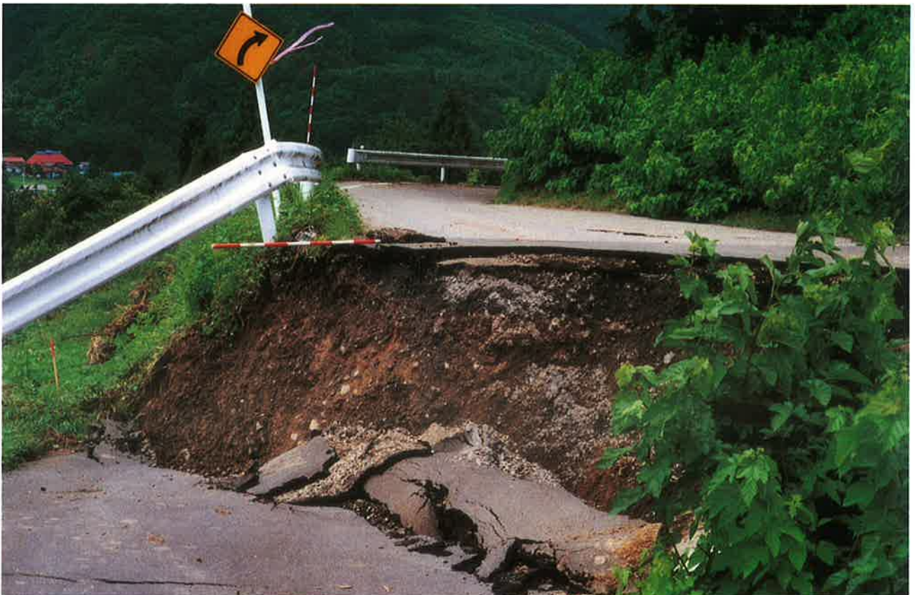
地すべりの頭部で県道陥没