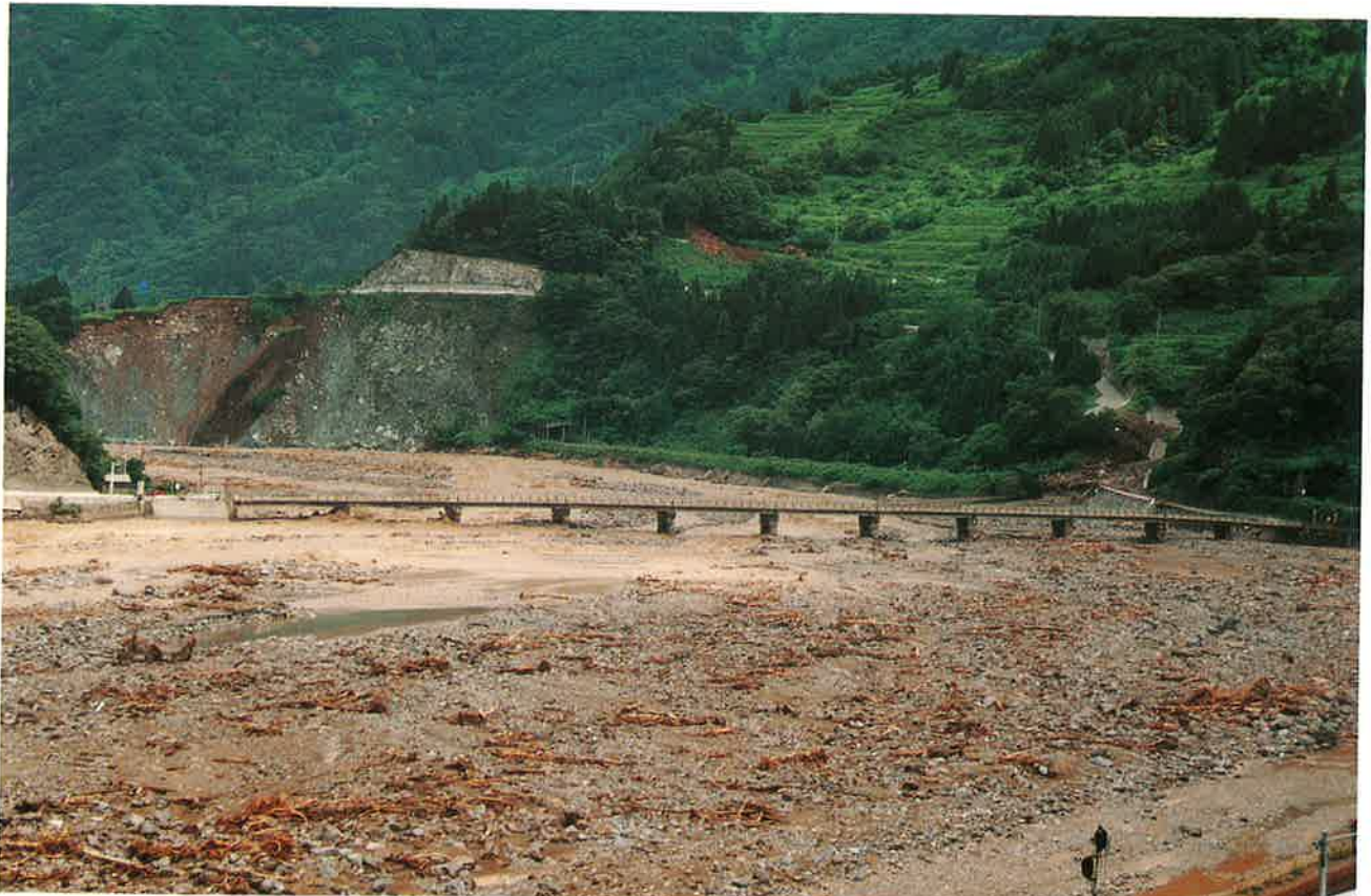
広い河原が土石で満杯