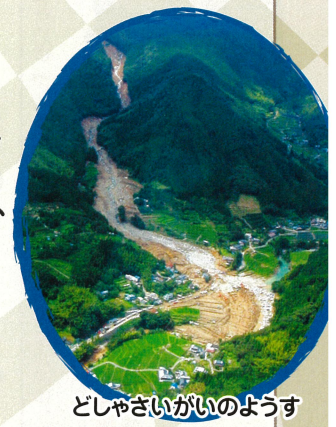
どしゃさいがいのようす

これまでの入賞作品は国土交通省砂防部Web サイトで見ることができます。 https://www.mlit.go.jp/mizukokudo/sabo/kaiga_sakubun.html