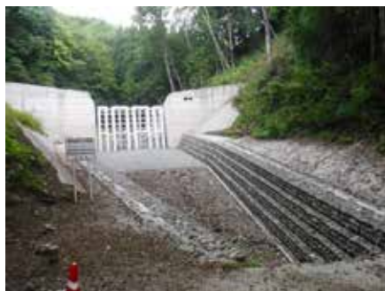
平成30年完成 扇沢 大町市 東海ノ口 (保全対象：人家22戸、国道148号、JR大糸線)