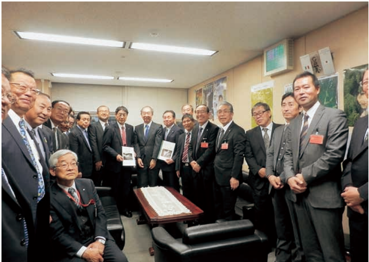
国土交通省 砂防部長室において