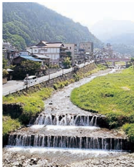
直轄第39号砂防堰堤 (大正13年(1924)竣工)

砂防の歴史や現在の取り組みについて情報発信を行い、減災へつなげていくことを目的にシンポジウムを開催しました。