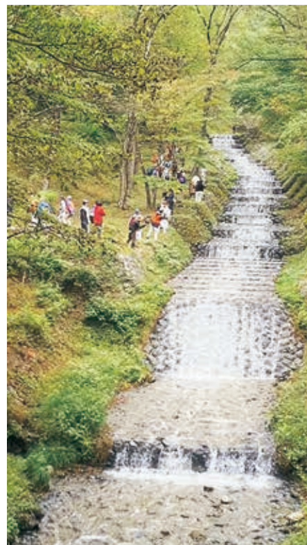
現地見学会の様子