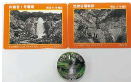
参加者に配布した限定の砂防カードと缶バッジ