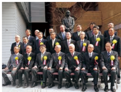
赤城正雄先生の銅像前で記念撮影