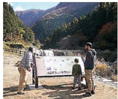
夜間瀬川に設置した砂防を紹介する看板を見る外国人観光客 (日本語・英語・中国語による3カ国語表記の看板を作製)

山ノ内町は、県内屈指の観光地であり、多くの外国人観光客も訪れています。砂防施設の文化的価値、防災意識の向上、観光地と共存する砂防についてさらなる取り組みが期待されるところです。