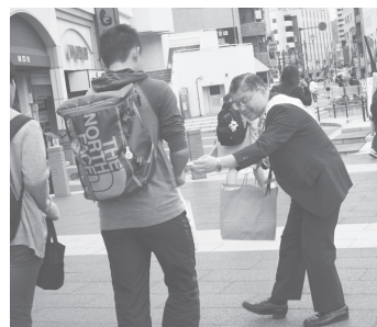
JR松本駅前の街頭宣伝活動の様子