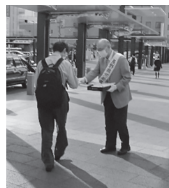
会長による街頭啓発の様子（松本駅前）