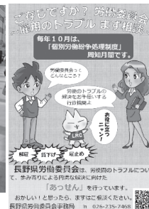
掲示したポスター