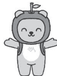
長野県観光PRキャラクター「アルクマ」