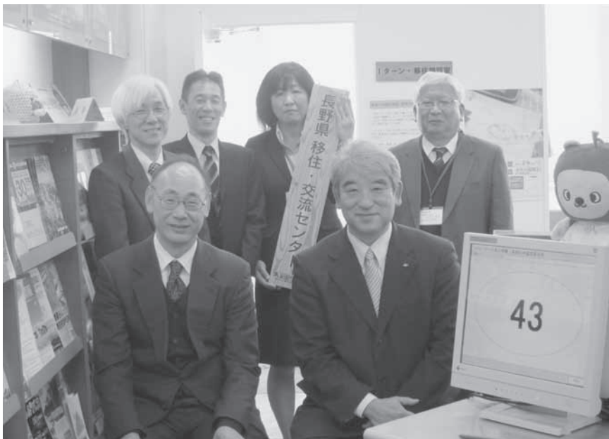
運用開始日には、本川長野労働局長(前列左)、県の太田商工労働部長(前列右)が出席されてセレモニーが行なわれました。