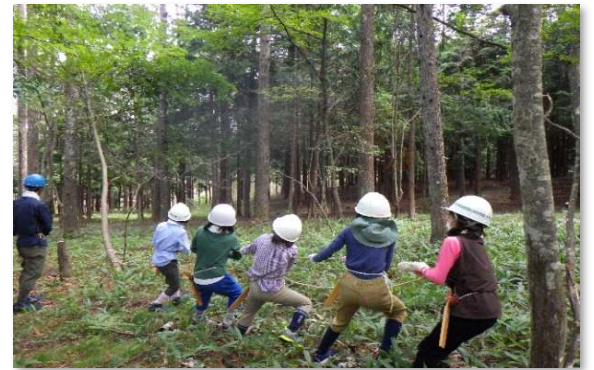
森林整備体験（伐倒体験）