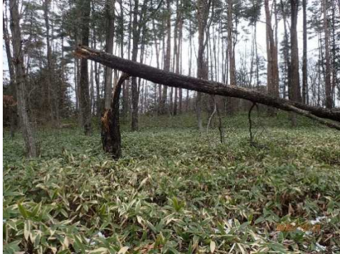
除去が必要なコナラの風倒木

また、自然パーク内に設けられた3つのフットパスは、誰でも利用することができ、小学生の遊び場や地域住民等を対象としたウォーキング、自然観察会などのイベントに活用されています。