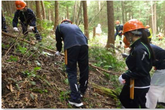
森林整備体験（除伐）