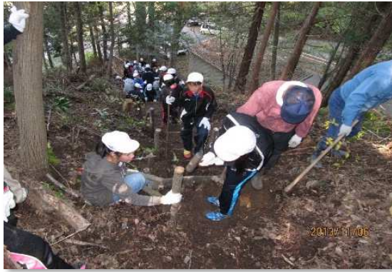
自然パーク内でのフットパスコース整備