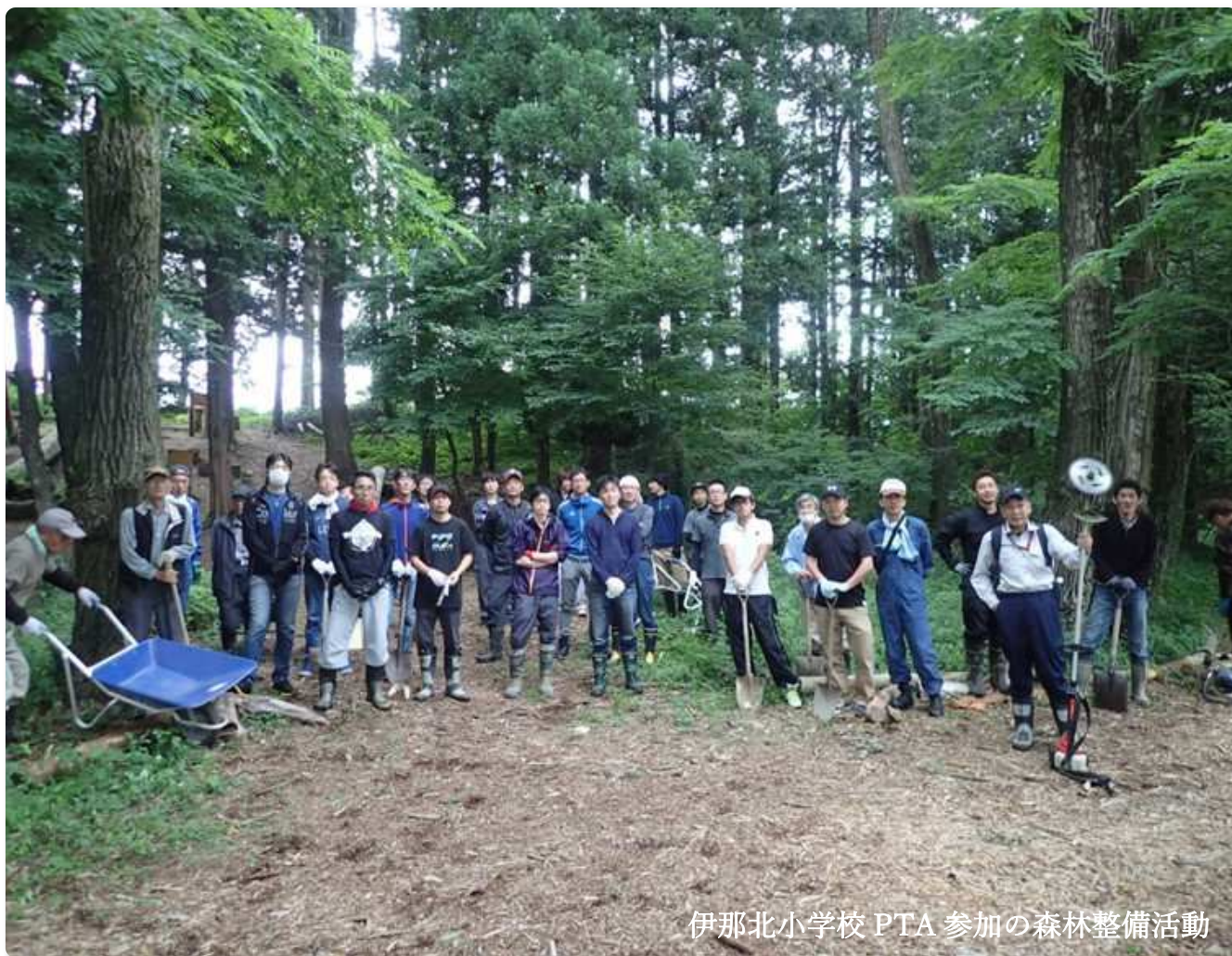
伊那北小学校 PTA 参加の森林整備活動

伊那市の中央に位置する上牧段丘林は、昔から生活するための重要な財産（木材・燃料・生活道・遊び場などで利活用）として守り続けられてきましたが、時代や情勢の変化により次第に活用されなくなりました。近年、環境保全や地域活性化の意識が高まったことから、再び段丘林を整備・活用することを目的として、平成 25 年 7 月 8 日に上牧区住民有志、伊那北小学校等の関係者により「上牧里山づくり」が組織されました。