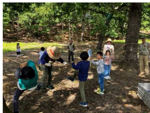
園児と地域住民の交流