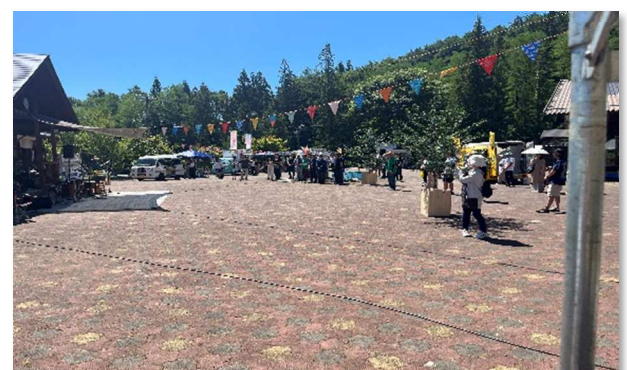
およりの森祭りの様子