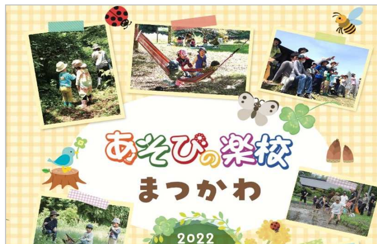
遊びの楽校 がっこう パンフレット

一般社団法人南信州まつかわ観光まちづくりセンターの運営により、松川町の子どもを対象に自然体験や外遊びを行う「遊びの楽校 がっこう 」を開催しています。小学生が森の中で自由に遊ぶ「森で遊ぼう」や未就学児対象の「森のこどもえん」は「およりの森」が活動の場となっており延べ約 500 名（令和 4 年度）の子どもたちが利用しています。