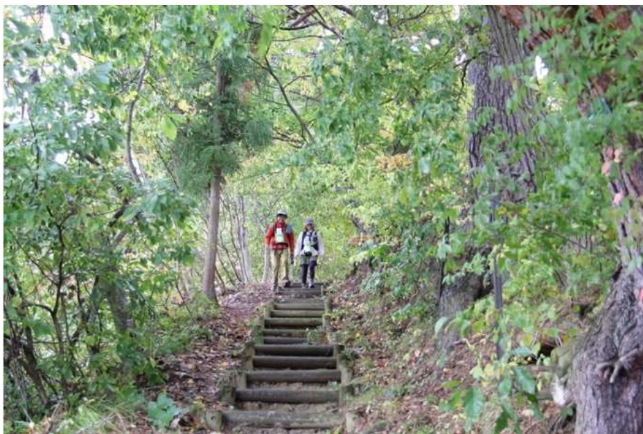
ONSEN ガストロノミーウォーキングの参加者 (一茶の散歩道)

「一茶の散歩道」をコースとして活用した「ONSEN ガストロノミーウォーキング」を令和5年10月に開催しました。「ONSEN ガストロノミーウォーキング」とは、「めぐる」「たべる」「つかる」をテーマに温泉街周辺を巡るウォーキングイベントで、約200名が参加されました。