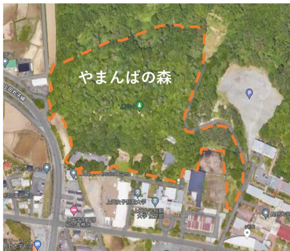
やまんばの森づくりプロジェクト活動区域

令和4年度から上田女子短期大学・附属幼稚園の『やまんばの森づくりプロジェクト』に参画し、森林整備や森林レクリエーションの指導・支援を行っています。やまぼうし自然学校関係者のほか子ども、保護者、幼稚園、地域住民など様々な関係者が幼稚園の裏山において、森林整備やレクリエーションなどを通じて、森林学習や地域の交流を行っています。