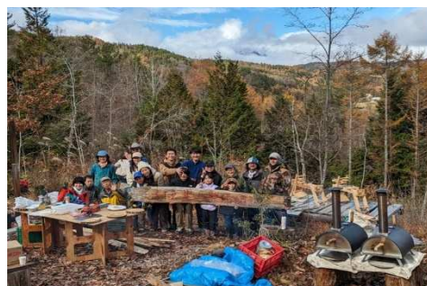
地区PTAとの共催イベントを毎年開催