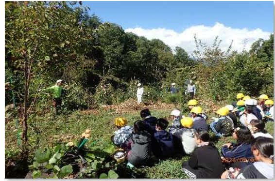
学校林森林整備体験