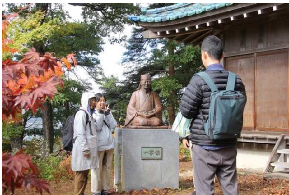
ONSEN ガストロノミーウォーキングの参加者 (一茶の散歩道沿道にある一茶堂)