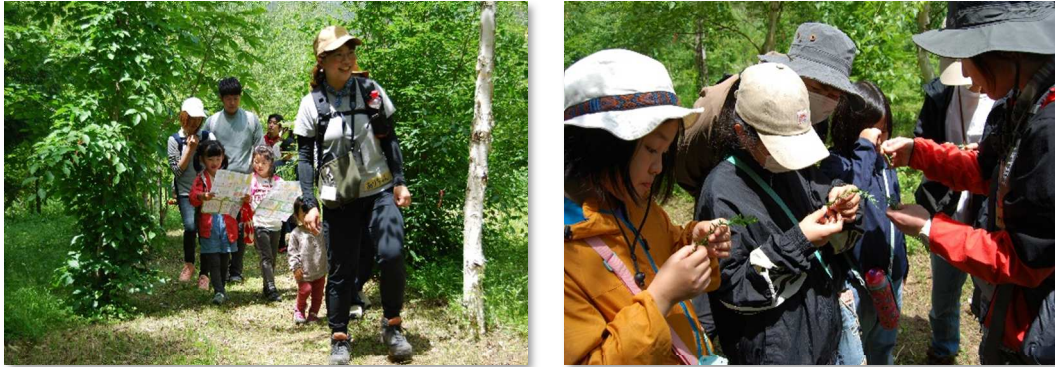
森林セラピーの様子

森林セラピーでは、森林セラピーの専門的な知識を持ったガイドとともに、森の中を散策しながら自然観察や森での遊びなどを体験できるようになっています。参加者数も年々増加しており、令和 3 年度 278 名、令和 4 年度 775 名となっています。