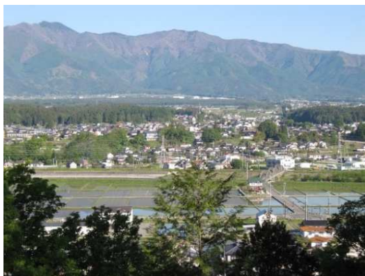
見晴台からの眺望

各種イベントへの参加や他の里山整備利用地域の住民を交えた勉強会を開催することにより、様々な立場や年齢層の方との交流ができ、会員の活動へのやる気の醸成や他地域との交流（関係人口）の増加につながっています。