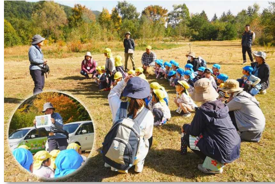
森のこどもえんの様子