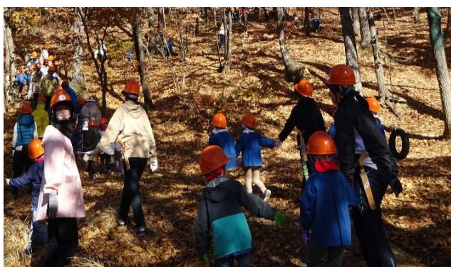
園児と短大生の交流