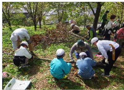
げんぼやま 玄蕃山夢プロジェクト