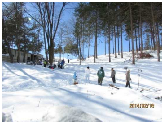
イベント（そり大会）の状況