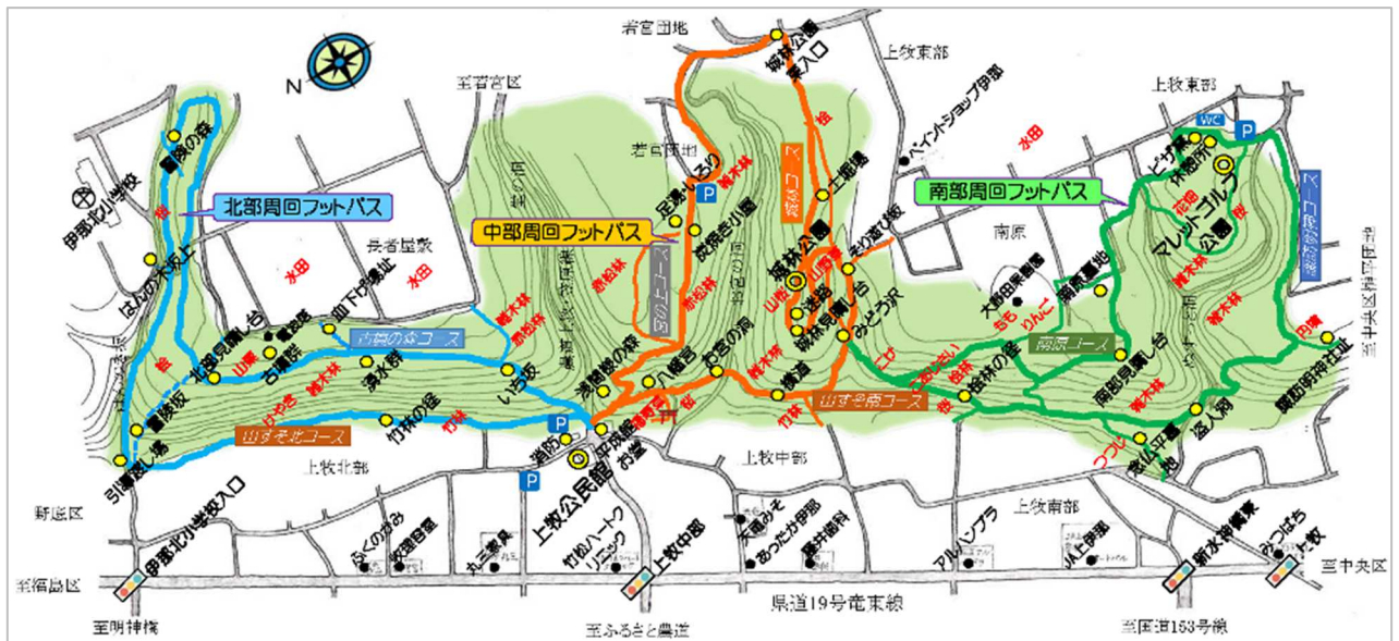
上牧里山自然パークのフットパス

フットパスとは、森林や田園地帯、古い街並みなど地域に昔からあるありのままの風景を楽しみながら歩くこと【Foot】ができる小径【Path】の意味で、イギリスが発祥地です。