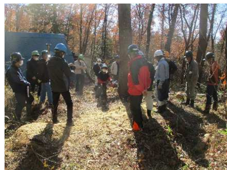
広葉樹伐採のための安全講習会

自然パークは基本的に常に開放されているので、管理者において危険箇所を把握するとともに、危険木除去や危険区域の周知（看板設置）などの安全管理を行っています。引き続き、特に管理者が把握できない入林者の事故等を防止する観点から必要な対策を講じていきます。