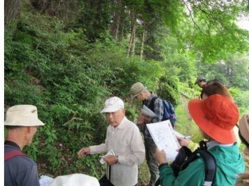
フットパスを活用した自然観察会

フットパスとは、森林や田園地帯、古い街並みなど地域に昔からあるありのままの風景を楽しみながら歩くこと【Foot】ができる小径【Path】の意味で、イギリスが発祥地です。