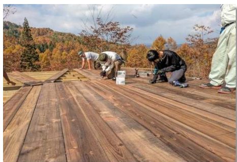
集いの場となるアルプス展望デッキの製作

イベント運営、施設管理、森林整備などの活動を継続させていくためには、資金収入が必要で、現在は行政からの支援をいただいておりますが、将来的には資金面でも自立できるよう里山利用や森林環境学習などを通じた自主財源の確保を模索しています。