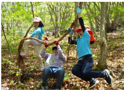
森でモリモリ遊び隊

イベントや講座を通じて参加者や住民を巻き込みながら、近隣の里山整備を行うことができました。(例：上田女子短期大学・附属幼稚園「やまの森」、上田市立神科小学校・長島自治会「 げんぼやま 玄蕃山夢プロジェクト」、財産区有林・菅平高原旅館組合「自然体験の森」)