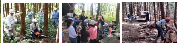
住民協働の森林整備

里山整備利用地域は、地域住民やその他の利用者らが主体的に里山の整備・利用に取り組む地域を、市町村長の申出により、長野県ふるさと森林づくり条例第26条に基づいて知事が認定するものです。 里山整備利用地域に認定されると、県は市町村と連携して、地域における里山整備利用活動を支援します。