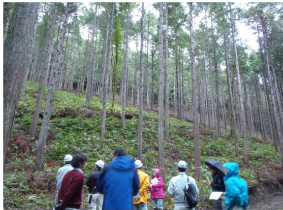
第2回 審査委員会 (現地調査①)