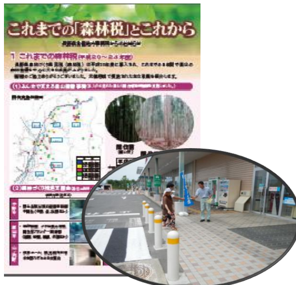
森林税チラシの作成と配布によるPR (北信管内)