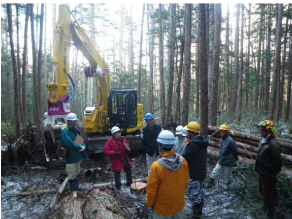
木曾地域会議現地調査 (木曾町開田地区の間伐現場)