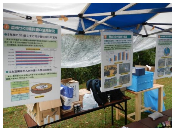
ご存じですか森林税 (塩尻市 木育フェスティバル)