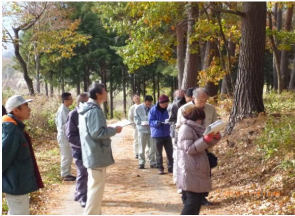
松本地域会議現地調査 (塩尻市北熊井地区の里山の集約化)