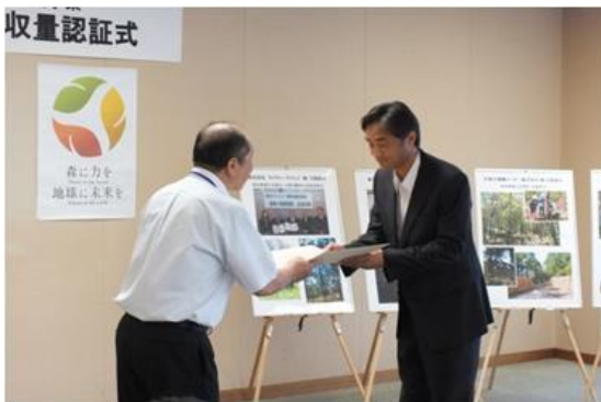
森林CO2吸収量認証式