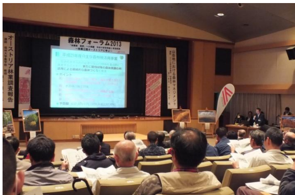
森林フォーラムにおける森林税の取組発表 (塩尻市 松本歯科大)