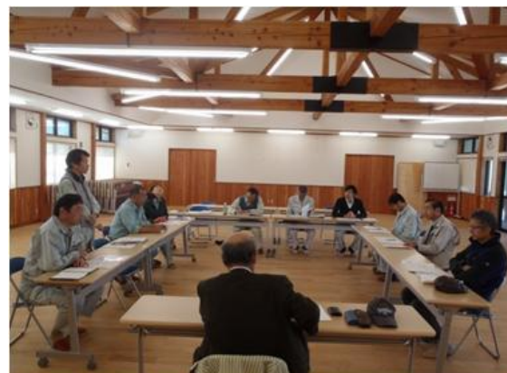
第2回 審査委員会 (検討会議)