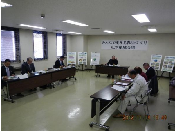
第1回 松本地域会議の開催状況