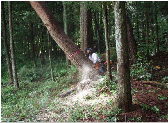
大桑村：松くい虫被害対策 平成24年度に松くい虫被害が新たに確認された大桑村で、集落周辺の補助対象外の森林にある被害木を薬剤によるくん蒸処理を実施