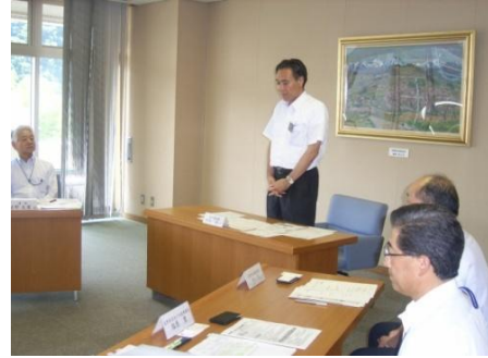
研修に先立ち開講式であいさつする阿部知事