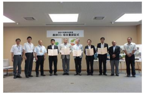
森林CO2吸収量認証式