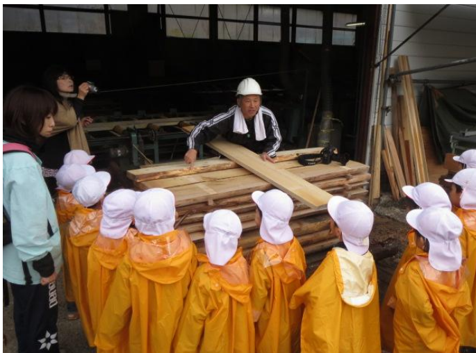
木育地域活動支援 (小谷村) 地域材利用のプロセス(製材段階)見学