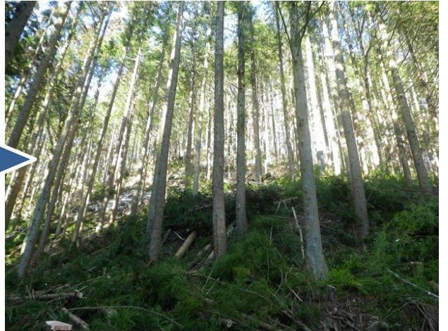
飯田市 浄玄寺団地