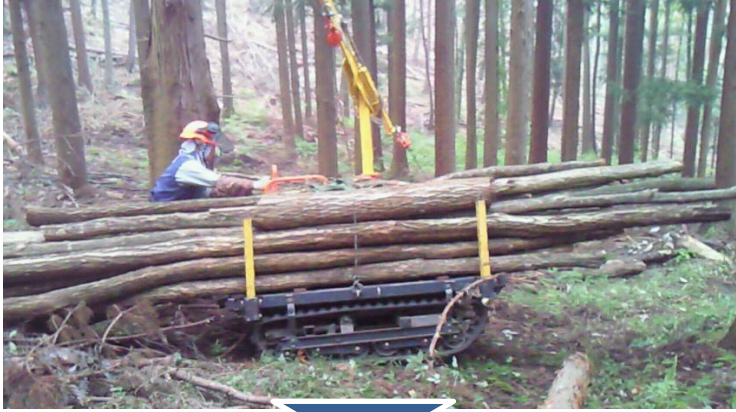
東筑摩郡朝日村 (事業主体:一期会)