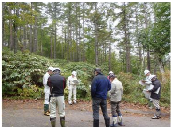
第2回 審査委員会 (現地調査③)