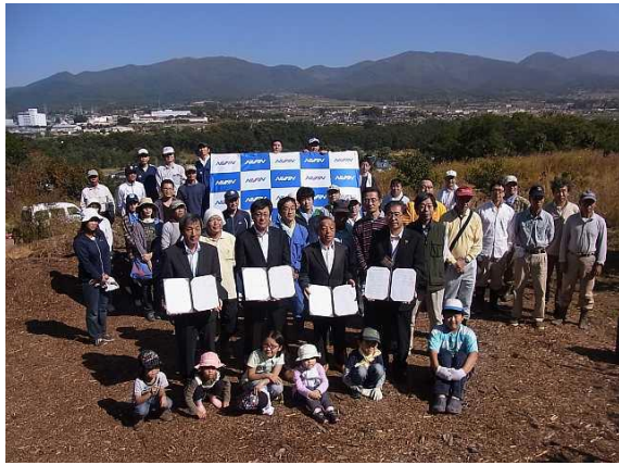
東御市での契約記念式典(日信工業と東御市島川原区 平成25年10月実施)