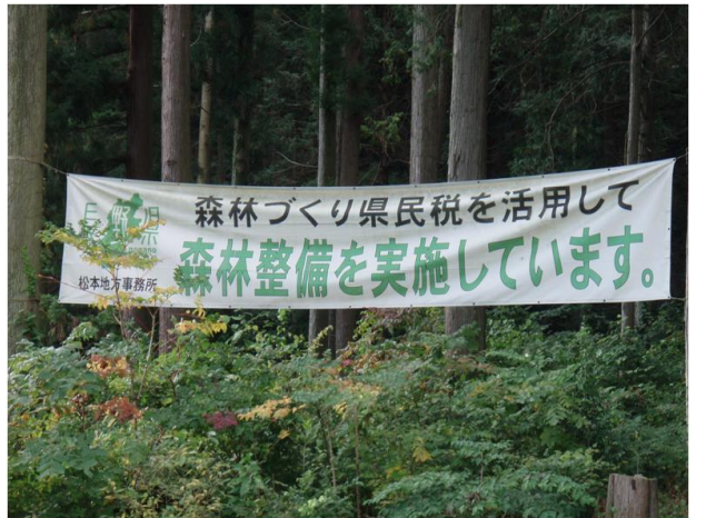
事業PR横断幕 (安曇野市)