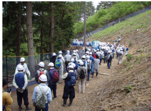
マツタケ増産のために新たにアカマツ林を 造成し獣害防止柵を設置 (諏訪市有賀林野利用組合)