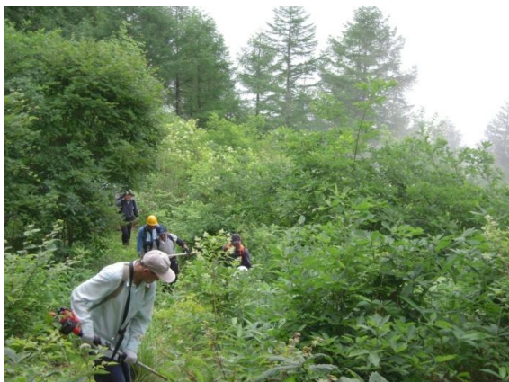
地区の里山を活用する登山道整備 のための草刈作業 (伊那市西春近自治協議会)