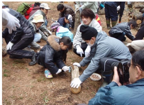
社員の家族による岡谷市でのシイタケ植菌作業(京セラ長野岡谷工場と岡谷市湊財産区 平成25年4月実施)