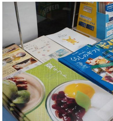
コンビニでの森林税リーフレットの設置 (長野市内 コンビニ)