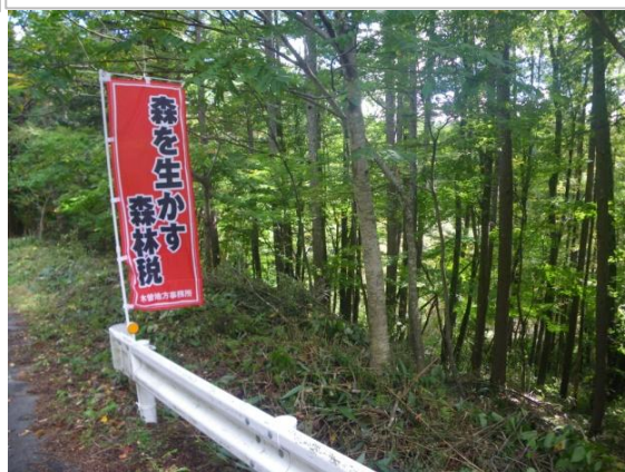
緩衝帯整備事業施行後のPR (木曽町)