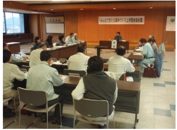
第2回 上伊那地域会議の開催状況