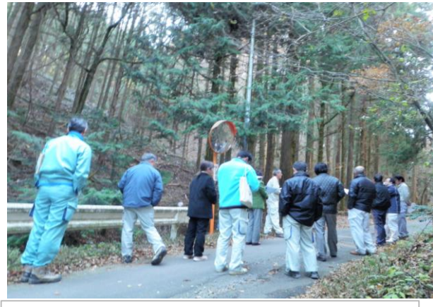
南信州地域会議現地調査 (飯田市山本地区の里山の間伐実施)