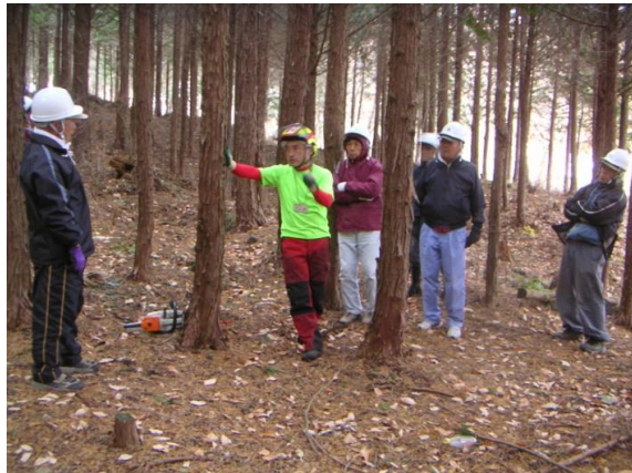
地域住民自らが里山整備を行うための 間伐技術講習会 (小諸市古牧財産区)