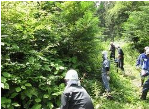
社員による南箕輪村有林におけるヒノキの下刈作業(サンティアと南箕輪村 平成25年8月実施)