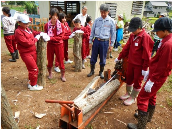
地元の子どもたちと協働で行う薪割り作業 (飯山市秋津区)