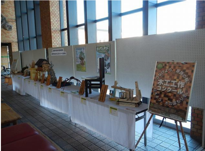
木育県域活動支援 (県木材青壮年団体連合会) 児童・生徒木工工作コンクールの優秀作品展示