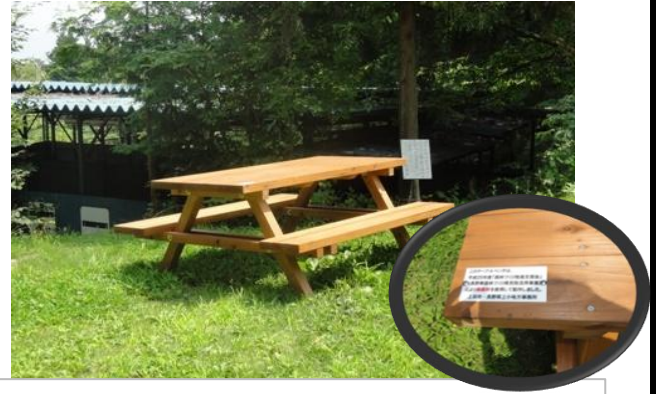
上田市：地域産材ベンチの設置 市民等が集う上田市別所温泉の森林公園に、地元産材で作成したベンチを森林税の活用PR解説とともに設置