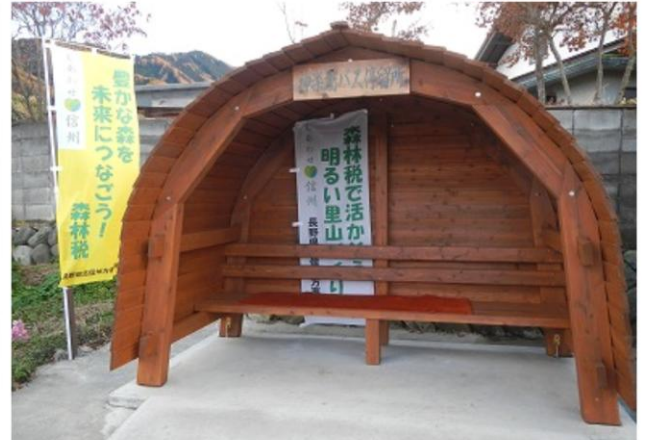
中野市：スギ間伐材バス停の設置 地域のスギ間伐材を利用し、屋根、ベンチ付のバス停を設置。併せて森林税のPRを実施