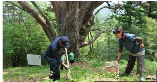
松くい虫により枯損した 天然記念物の後継樹育 成(松本市四賀林研)