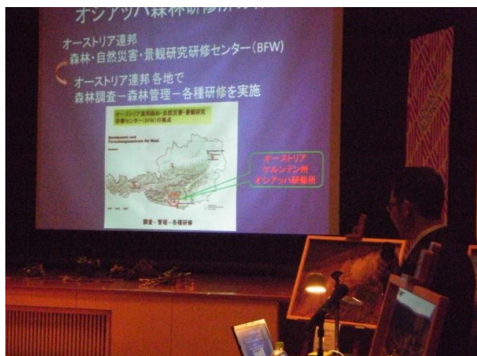
第2回集合研修(H25.8.29) 森林フォーラムで研修報告を行う フォレストコンダクター候補生