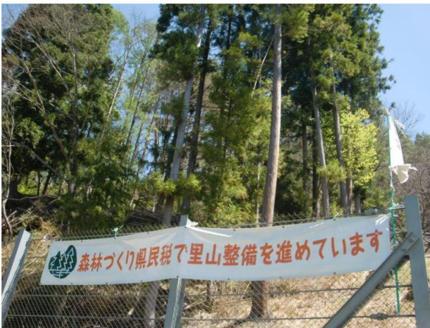
事業PR横断幕 (大鹿村)