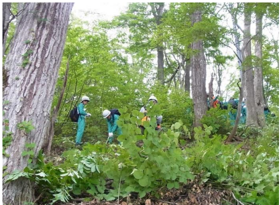
中学生による信濃町の県有林における除伐作業(成城学校と長野森林組合 平成25年7月実施)