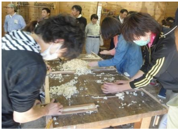
新規採用職員研修として行った朝日村での木工体験(相澤病院と朝日村三区生産森林組合 平成25年10月実施)