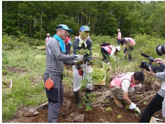
一般参加者によるカヤの平高原でのブナの植樹(森のライフスタイル研究所と木島平村 平成25年6月実施)