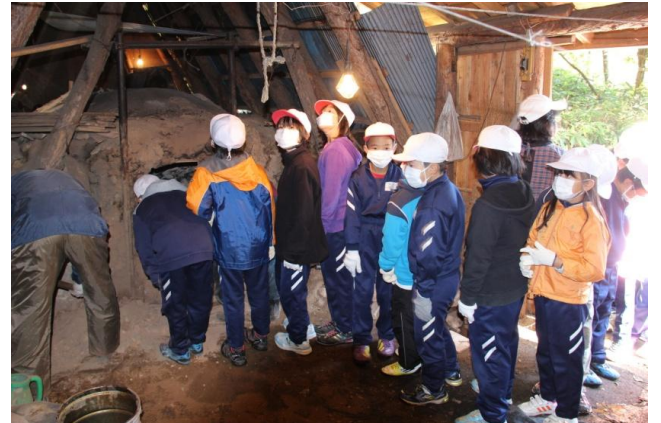
松川村：炭焼き体験教室 地元小学生を対象にして、地域の森林の現状や森林の役割等を学び、地元の木を木炭として利用する炭焼き体験を実施