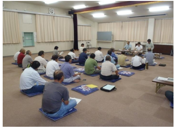
集落説明会の実施状況