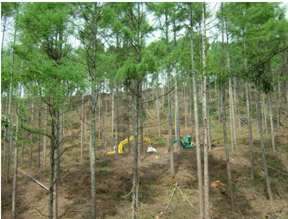
茅野市：森林整備のかさ上げ 信州の森林づくり事業を活用して実施している搬出間伐に対して、補助金のかさ上げを実施