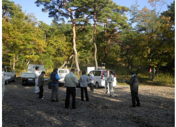
上小地域会議現地調査 (上田市東山地区の里山における危険枯損木処理の取組)