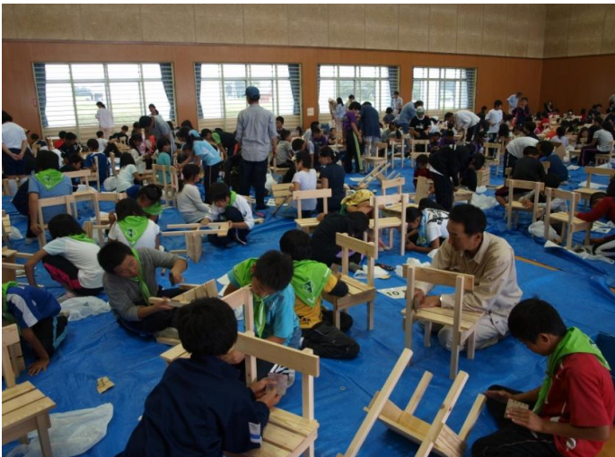
木育地域活動支援 (飯島町) みどりの少年団交流による木製いす製作の実体験