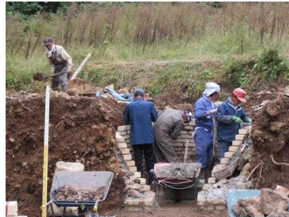
地域で過去に行っていた炭焼きを復活させる ための炭窯の建設作業 (小谷村大網 大網炭焼きの会)