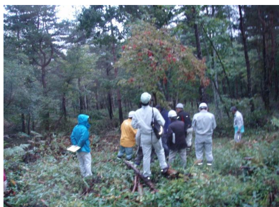
第2回 審査委員会 (現地調査②)