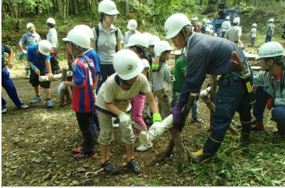
佐久穂町：白樺の森の景観形成整備 姉妹都市である府中市民約100名と地域住民等を対象とした森林整備体験学習及び白樺林の景観形成整備を実施