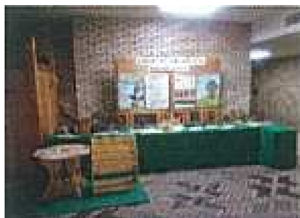
県庁ロビーでの優秀作品展示