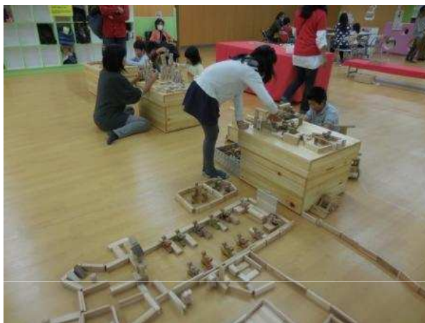
木製玩具の体験コーナー