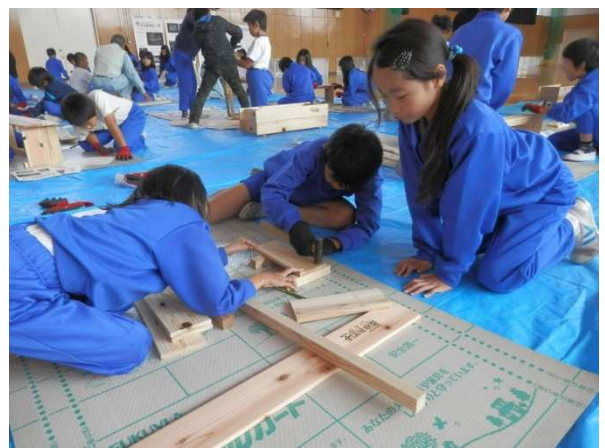
間伐材を利用した木工製作