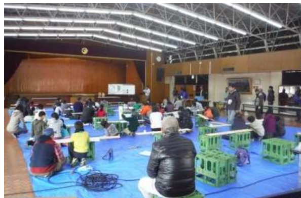
町職員による林業に関する説明