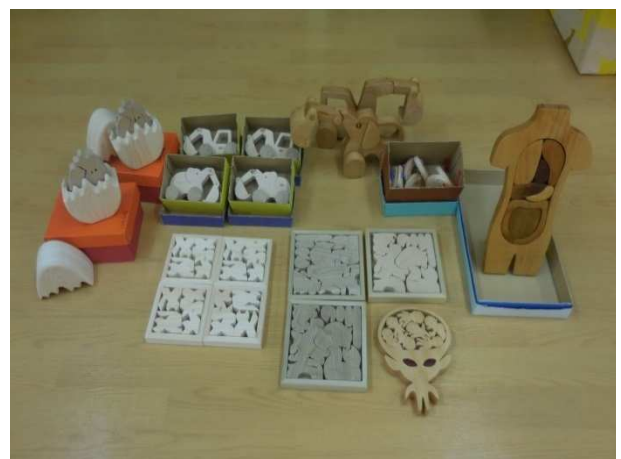
市内の保育園に貸し出された木製玩具 (一例)