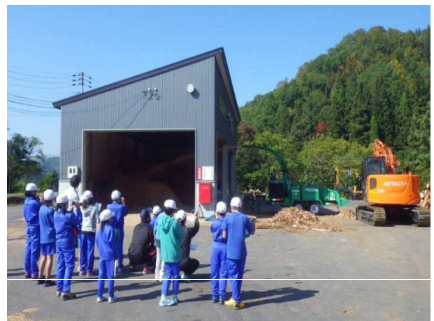
木材チップ工場の見学