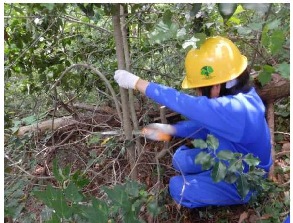
学有林の下刈り作業