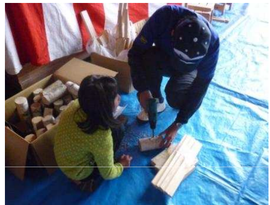
木工体験コーナー