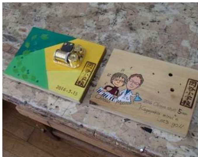
アカシアの木を台座とした校歌オルゴール