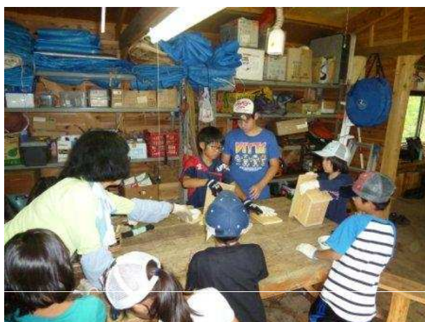
小鳥の巣箱づくり