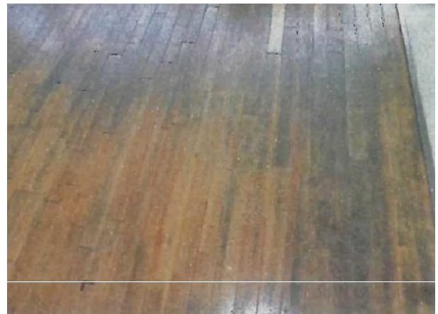
補修作業中の机と床