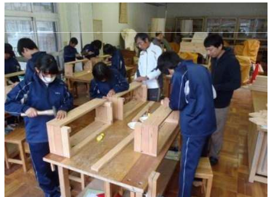
プランターの組立作業