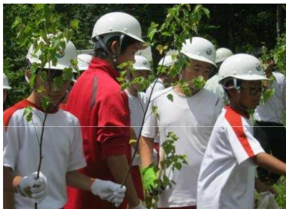
学校林での植林作業