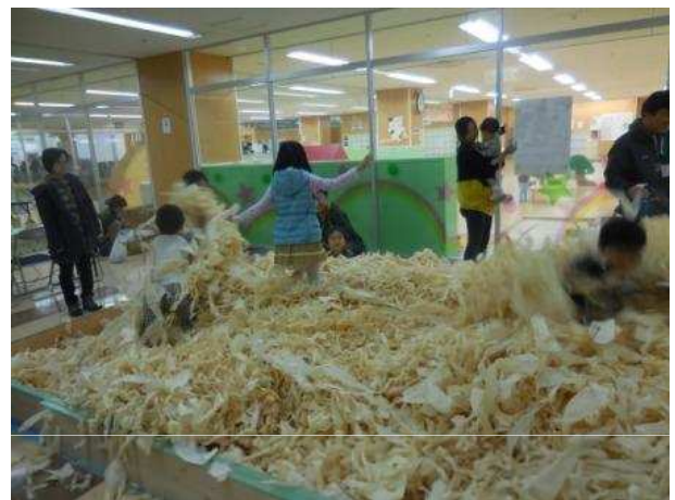
かんなで削った木くずのプール