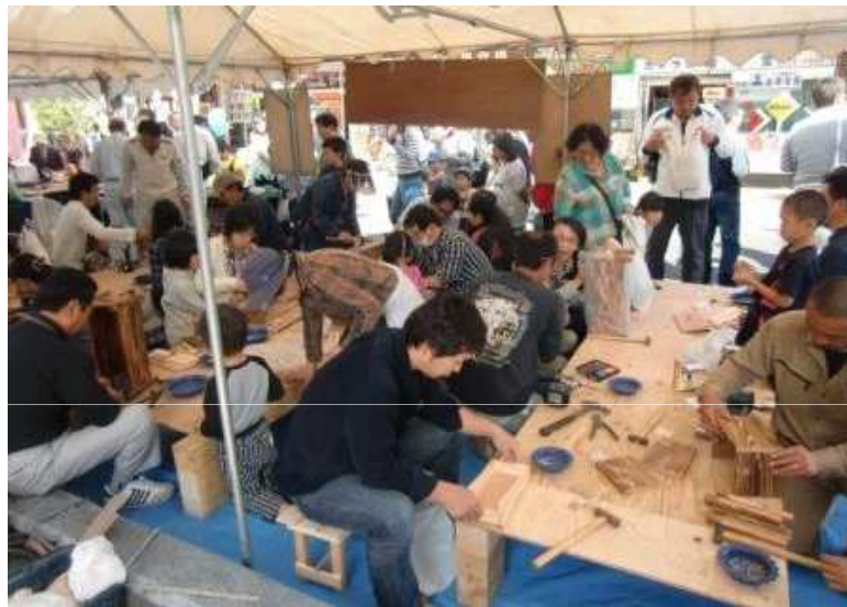
プランターの木製カバーの製作