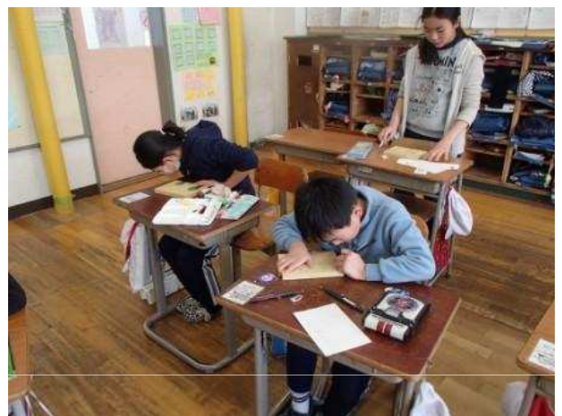
オルゴールの台座の製作