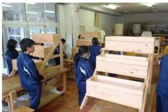
完成したプランター