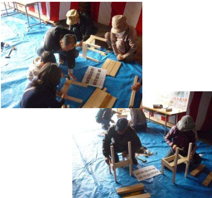
木製の椅子の製作