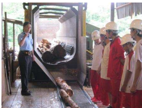
製材所の生産現場見学