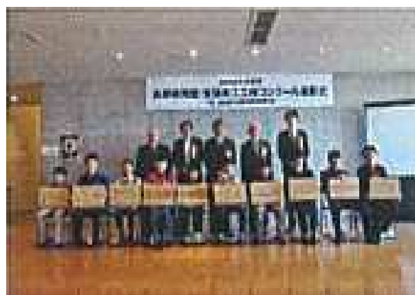
木工工作コンクール表彰式