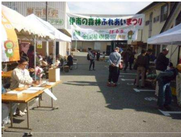
伊南の森林ふれあいまつり会場