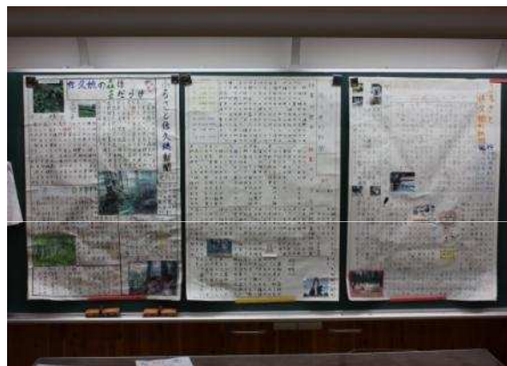
子供たちが作成した森林新聞