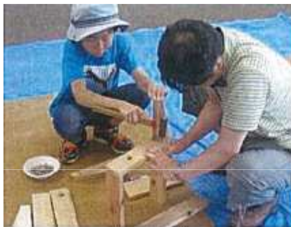
木工教室 椅子づくりの体験