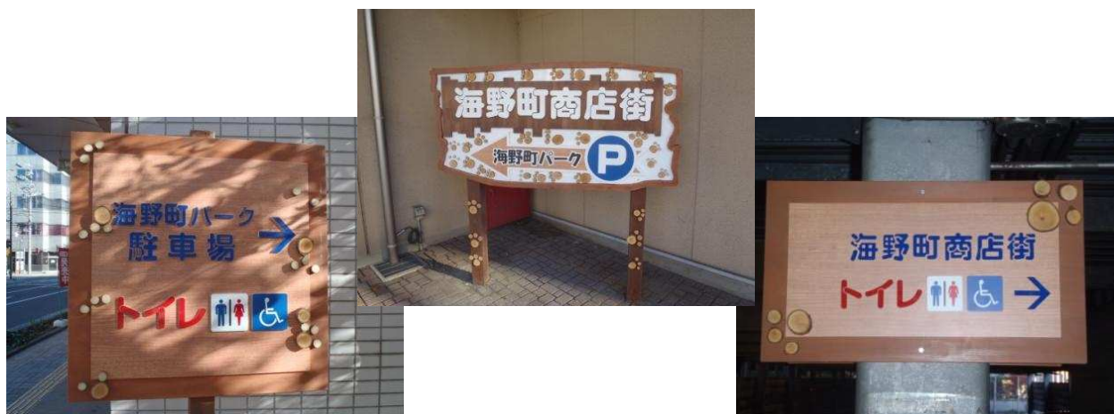
商店街の木製の案内看板(一例)