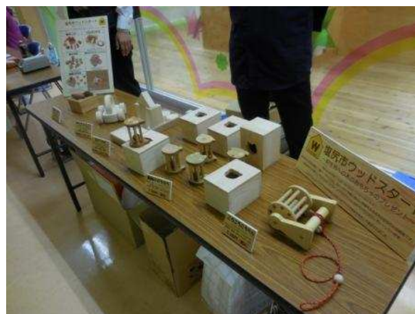
ウッドスタートで新生児に贈られる木製玩具