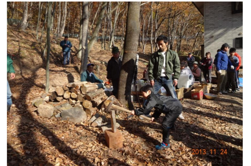
整備で発生した木材を地域住民の皆さんで薪に加工