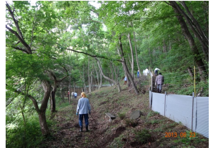
森林整備は住民参加で実施