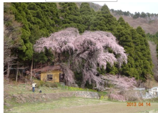
多くの皆さんが地区内の桜見学に来訪され、地域で「おもてなし」