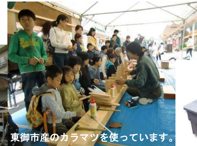
東御市産のカラマツを使っています。