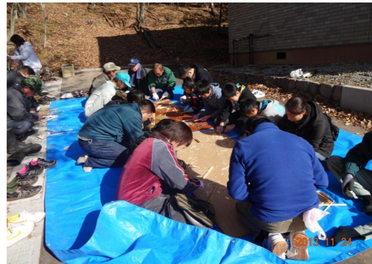
整備した森林内で木工体験を実施