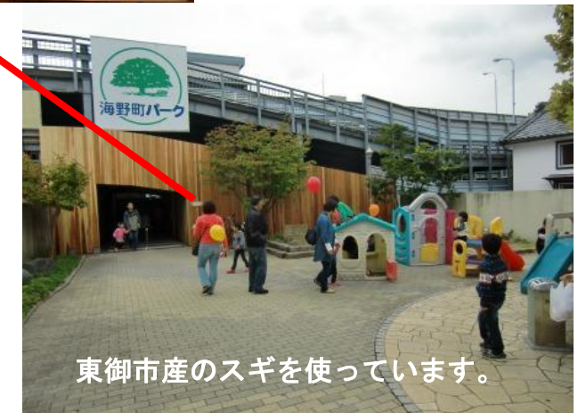
東御市産のスギを使っています。