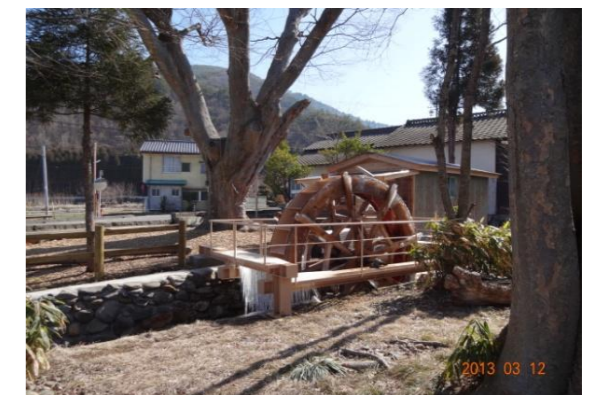
小水力発電にも挑戦しています。