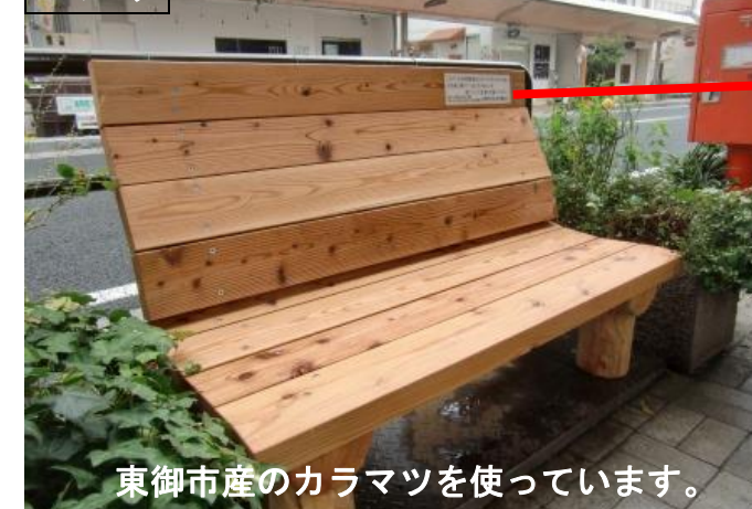
東御市産のカラマツを使っています。