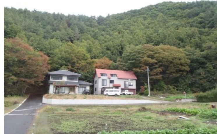
大日向町 整備森林の遠景