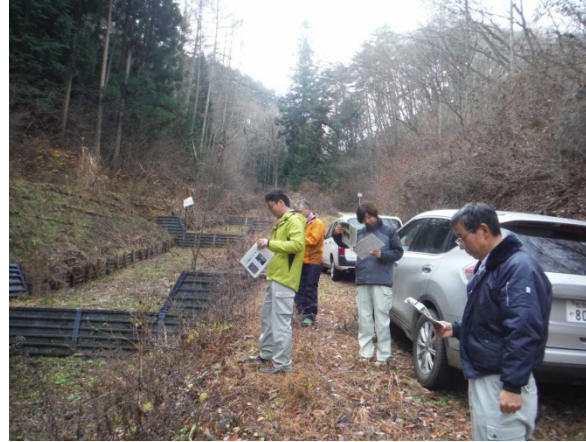
南信三郡治山研究会