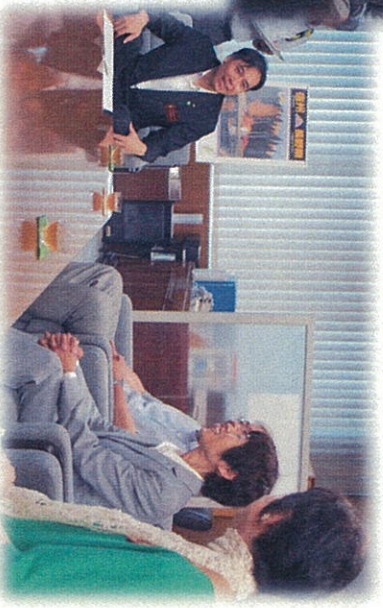
長野県「山の日」懇話会からの意見書の手交