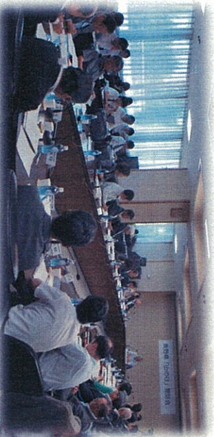
長野県「山の日」懇話会 会議風景