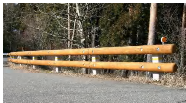
写真-1 信州型木製ガードレール （上から1，2，3号型）