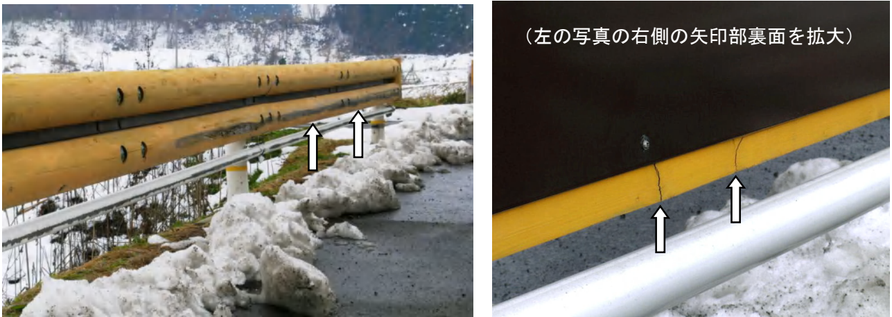
写真-3 木製横梁への自動車の接触痕と、曲げ破壊による亀裂(矢印)