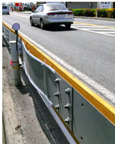
写真-2 鋼板の膨れ(応急処置として上下にビニールホースが付けてある)

1号型の鋼板のボルト穴は、微調整ができるように、横長に加工されていた。木材と鋼材では膨張・収縮が同調しないため、この穴の部分で有効な調整ができるよう、ボルト基部の形状と締め加減を変更した。その結果、同様の膨らみは大幅に減少した。