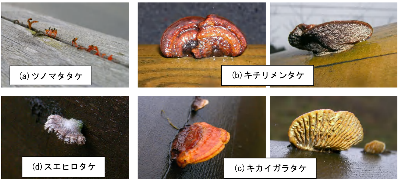
写真-4 木製横梁に観察され始めた子実体