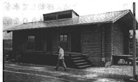
【写真-5】 長いひさしと高い床