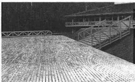
【写真-1】 野外デッキ 国立信州高遠少年自然の家

カラマツ材も内装から外装に、あるいは野外に使われる例が増えています。従来の木レンガ、木製防音壁などに加えてバルコニー、野外デッキ、野外遊技施設などが目立っています（写真-1）。