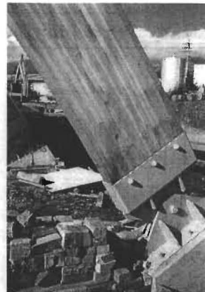
【写真-3】 大断面集成材の建物の脚部 雨じまい（雨水のはけ）がむずかしい

建物のひさしを長くしたり土台の布基礎を高くして雨水の跳ね返りを避けるなど設計上にくふうを凝らしています（写真-5）。