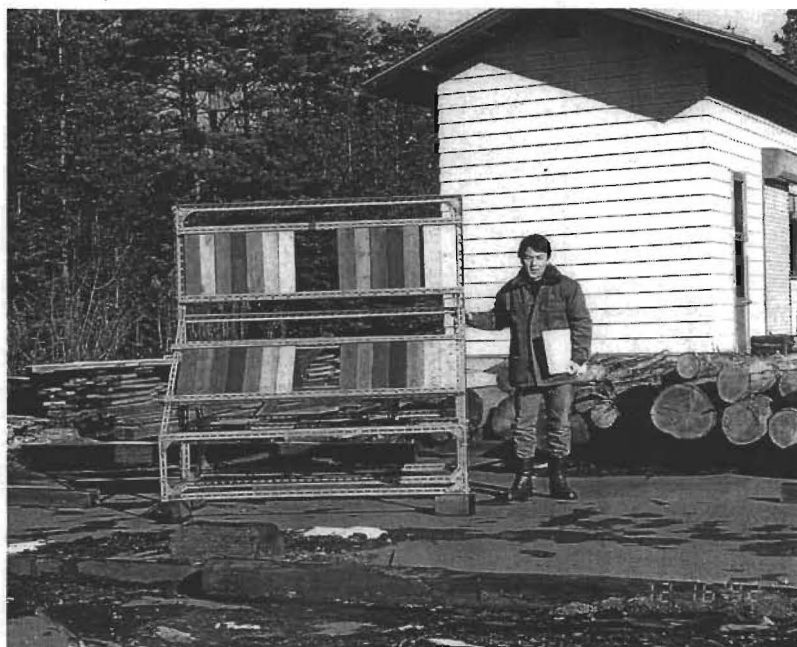
【写真-6】 野外暴露試験