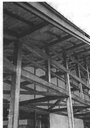
【写真-4】 風雨にさらされる部分の変色