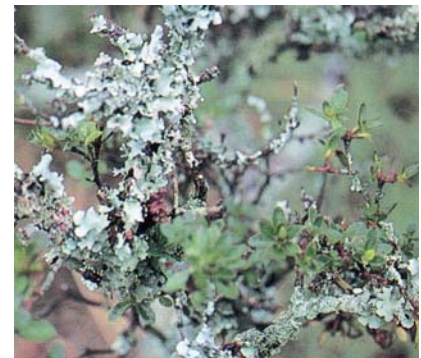
ツツジに着生した地衣類

地衣類 が、ツツジやウメの小枝に密に着生すると小枝が枯れてしまうことがあるため、庭木への 地衣類 の着生は嫌われます。 地衣類 は、大気汚染に対して敏感であることが古くから知られており、大気汚染指標として調査に利用されることもあります。 地衣類 が大気汚染に敏感な理由としては、これらの植物が生活に必要な水分、養分を雨水に頼っているため、草や樹木に比べ汚染物質の吸収量が多いこと、成長速度が遅く、被害後の回復