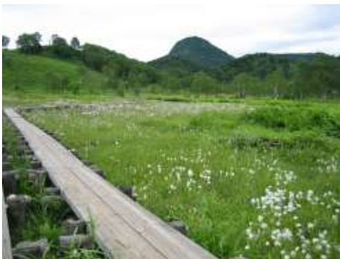
田ノ原湿原「自然探勝コース」