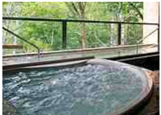
高原内には多様な温泉も