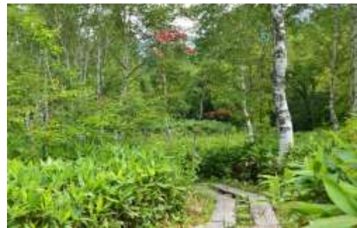
小雑魚川に沿った木道「せせらぎコース」