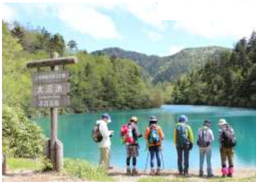
大沼池「池めぐりコース」

子どもやお年寄り、車椅子の方も楽しめるファミリーコース。白樺、ダケカンパ、ナラの木などが続き、明るく気持ちのいい遊歩道が続きます。湿性植物の豊富な一帯には様々な花の群生が見られます。