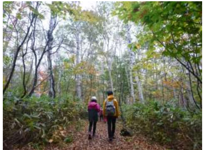
高原を代表する白樺林をはじめ多様な森林に囲まれる「奥志賀白樺苑路コース」