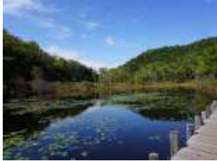
スイレンが美しい