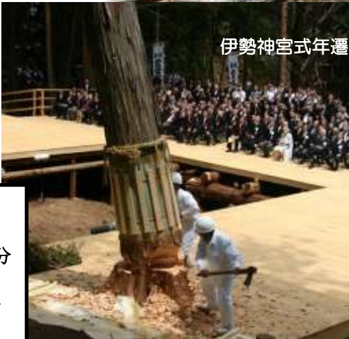
伊勢神宮式年遷宮 御杣始祭