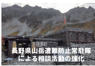
長野県山岳遭難防止常駐隊 による相談活動の強化