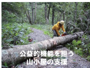
公益的機能を担う 山小屋の支援