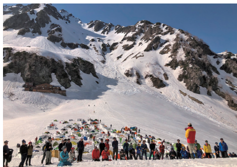
テント場のやまびこ安全講話

また、ハイシーズンや長期の連休など登山者の集中が予想されるときは、実際に山を歩いて登山者に声掛けをする山岳パトロールを行います。パトロールは泊まり掛けで行うこともありますが、その際は、夕方にテント場や山小屋で短時間の「やまびこ安全講話」という活動を行っています。安全講話は、実際の遭難事例を引き合いにしながら、遭難しないための具体的な注意点などをお話するのですが、昨年の7、8月の夏山期間中は、県下で延べ102回行い、約4800人の登山者の皆さんに聞いていただいています。1件でも悲惨な遭難を減らしたいという思い