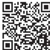
苗場山頂ヒュッテ

碓氷川ルートは神楽峰から標高差150mを下って鞍部を渡り急登を200m登り返します。神楽峰ピークまでにバテている様なら時間と相談をして撤退をお願いします。