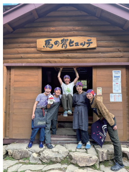
ヒュッテのゆかいな仲間たち