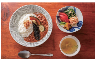
山小屋自慢のジビエカレー

馬の背ヒュッテの 夕食は、手作りの鹿肉カレー です。花の百名山でもある植生の豊かな仙丈ヶ岳ですが、鹿の食害によって本来あった植生が失われてしまっているのが現状です。