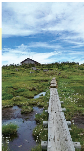
ヒュッテ周辺の湿原と木道

数箇所にはロープや鎖場があり、8.5合目より一気に開ける山頂湿原の景色は圧巻です。この先は木道歩き（一部樹林帯、岩場あり）となり、湿原と木道を一番長く楽しめるルートです。登山後は酸化した鉄分で赤く染まる温泉「楽養館」で食事もとれ癒されます。