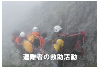
遭難者の救助活動