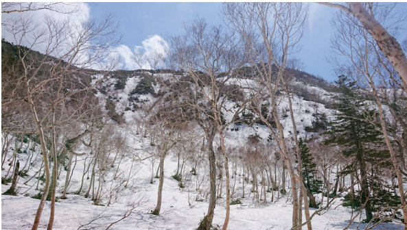
6月の小赤沢ルート5合目

苗場山の登山適期は7月～10月上旬までです。今シーズンは少雪が予想されますが、例年であれば残雪期（6月～7月上旬）はアイゼンを要する雪渓のトラバースや直登、ホワイトアウトによるルートの見失い等、夏山とは違うリスクがあります。特に山頂台地は平坦なため、雪に覆われていると目印になるものが少なく、ホワイトアウト時に山小屋にたどり着く