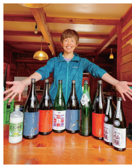
女将おすすめの本酒達