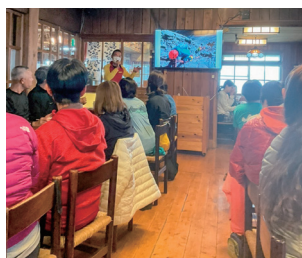
山小屋のやまびこ安全講話

一山岳遭難救助隊（以下「山岳救助隊」）を率いる隊長という立場ですが、山岳救助隊の皆さんはどのような仕事をしているかお聞かせください。