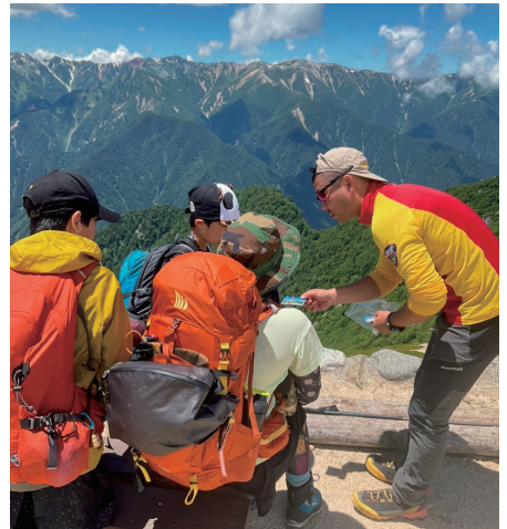
パトロール中の声掛け

冬季や岩場などで発生した遭難は、救助活動そのものに危険が伴います。ただ、そのような現場は、遭難者を救助すれば完了するため、確かに苦労はありますが一時的です。一方で