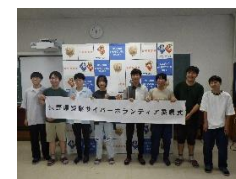
長野県警察サイバーボランティア委嘱式