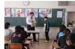
スクールサポーターによる非行防止教室