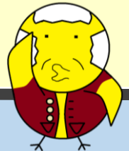
特殊詐欺被害抑止キャラクター 「ピジいさん」