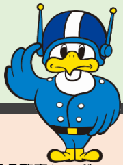
長野県警察シンボルマスコット 「ライポくん」