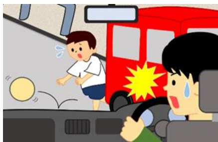
長野県内における小学生の歩行中事故死傷者数(R1～R5累計)