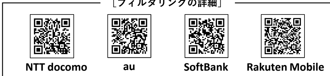
[フィルタリングの詳細]