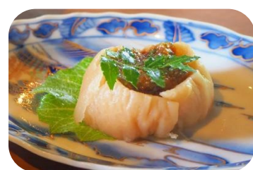
※各画像は参考画像となります

1 日時 2024年2月3日(土) / 10日(土) / 17日(土) / 24日(土) 2 会場 笹原観光まちづくり協議会事務所 ※詳細は予約完了後にご連絡します