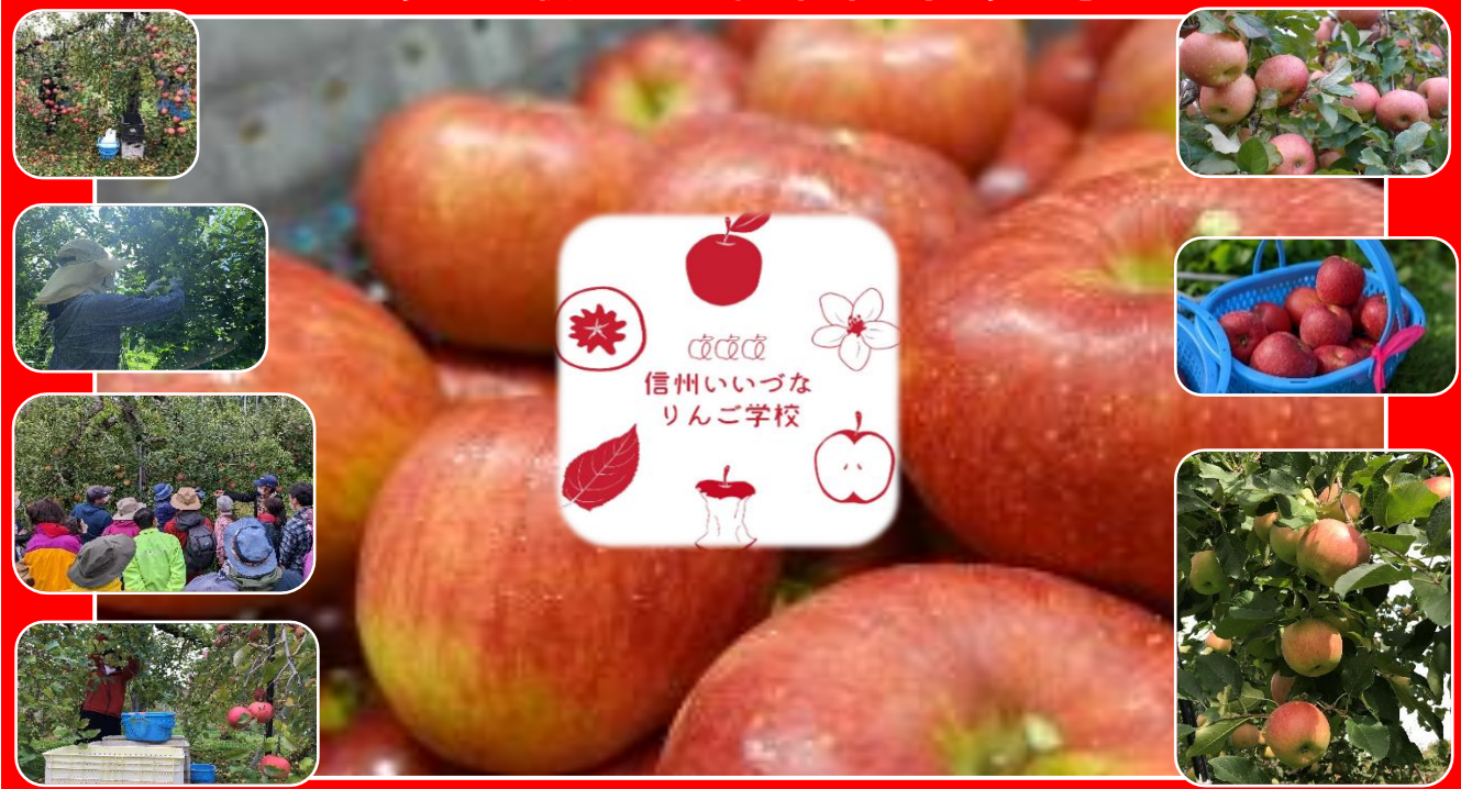
※各画像は参考画像となります