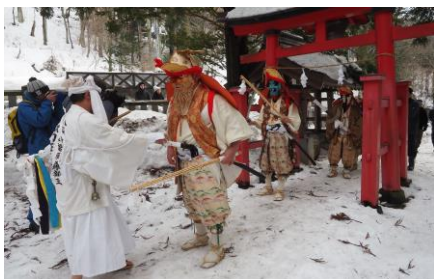
上林不動尊到着、鳥居をくぐります⇒