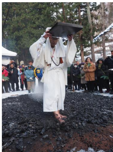
千駄焼後の火渡り⇒