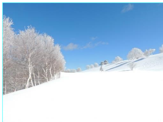
※各画像は参考画像となります