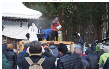
神事の最後は御供まきとなります