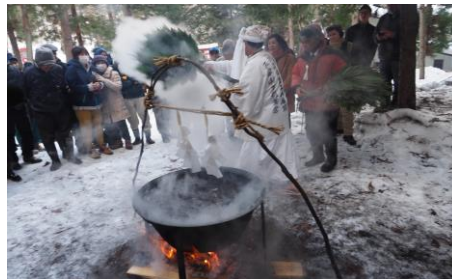
湯の花行事の様子⇒