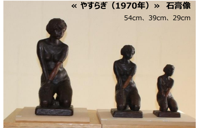
« やすらぎ（1970年） » 石膏像 54cm、39cm、29cm