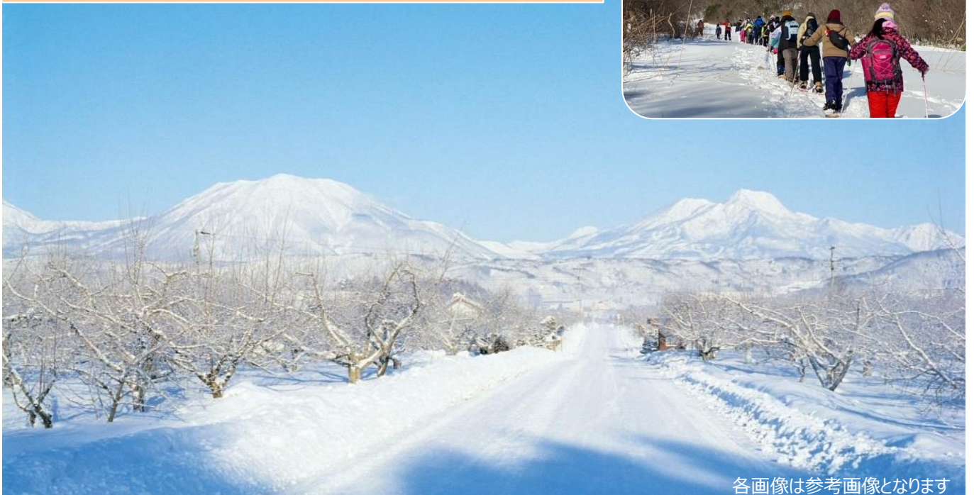
各画像は参考画像となります