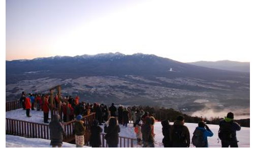
御来光に照らされる八ヶ岳連峰