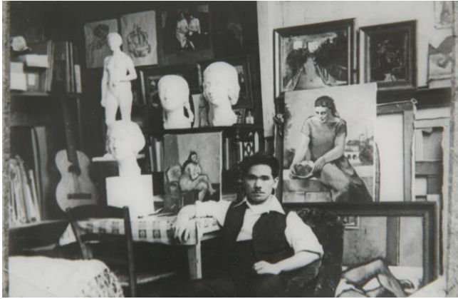
清水 多嘉示 アトリエにて

原村出身の芸術家、清水多嘉示の作品のうち、当館が収蔵するモニュメント（大型彫刻）の石膏原型や、サイズの異なる作品を展示し、ブロンズ彫刻の奥深さを紹介します。会期中は、ブロンズの製作過程を知る鑄造ワークショップや、当館所蔵の清水多嘉示のブロンズ像について解説する、美術館職員によるギャラリートークを開催します。