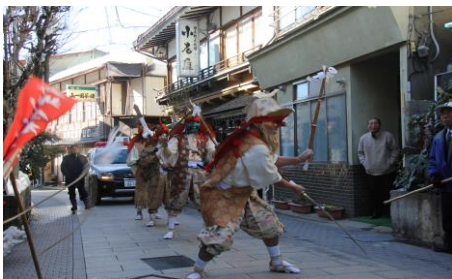
神事は渋温泉街をスタート⇒

コロナ禍は中止となっておりました上林温泉千駄焼き、今年は開催予定です。御嶽教中正講社の行者が中心になり行われ、家内安全・護身（五難七難即滅）・盗難よけ・占い等の要素をもっているといわれます。まず禊祓（みそぎはらい）をし、渋温泉街から上林までの道中でしめ縄切りを行いながら、上林不動尊に到着した後、湯の花行事、鍬加持、千駄焼きと火渡り、御供まきが行われます。