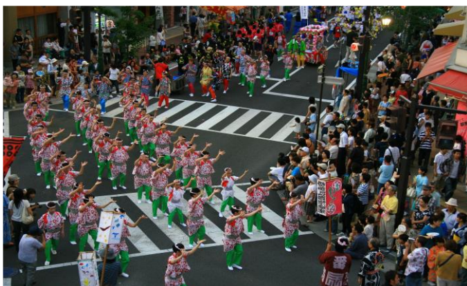
上田の街に響く「わっしょい♪」

令和5年の上田わっしょいは、4年ぶりに市街地で開催します！昭和47年(1972年)から続く、踊る！担ぐ！叩く！がテーマの上田の夏まつり「上田わっしょい」。映画「サマーウォーズ」にも登場する夏まつりです。自治体や学校、企業、サークル活動の団体で一つの「連(れん)」を作り、真夏の夜空に響く「わっしょい」の掛け声とともに、爽快に歌い踊るお祭りです。踊りも正調だけでなく連独自のオリジナル踊りを踊っていただくことも可能です。踊りのほかに、みこしを担ぐ、太鼓を演奏するといった形でもご参加いただけます。