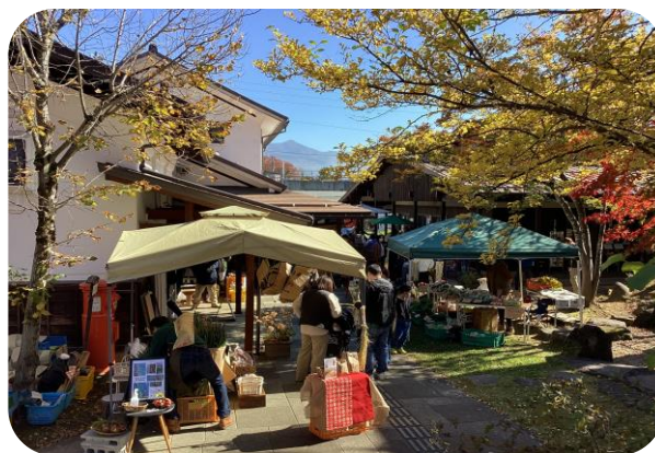
生産者と皆様とをつなぐマルシェの様子