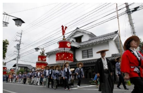
※各画像は参考画像となります。

1 日時 7月21日(金)：天王下ろし 8:00～11:00 頃 7月25日(火)：天王上げ 19:30～20:30 頃