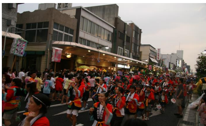
夕暮れ時には最高潮に！