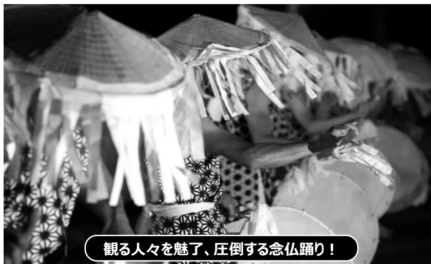
観る人々を魅了、圧倒する念仏踊り！