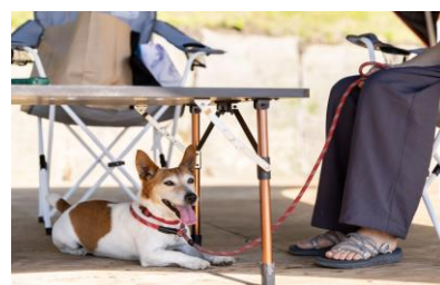
相棒のペットも一緒にバカンス♪