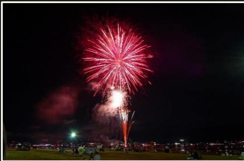
大輪の花火が諏訪の夜空を彩ります♪

夏の諏訪湖は毎日花火。上諏訪温泉前の諏訪市湖畔公園では、7月28日～8月27日の期間中毎日花火が上がります。花火は湖畔公園を中心に自由な場所でご覧いただくことができます。諏訪湖畔には上諏訪温泉の旅館ホテルが並んでいて、旅館のお部屋や大浴場などから花火を見ることもおススメです。また、期間中はビアガーデンやナイトクルーズなど、花火を楽しめるイベントも開催されています。