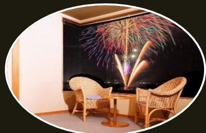
極上のひとときをどうぞ！