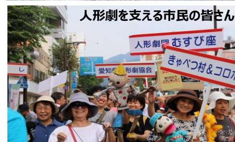
人形劇を支える市民の皆さん