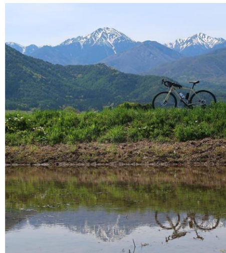
過去の投稿写真 例) ※参考画像となります