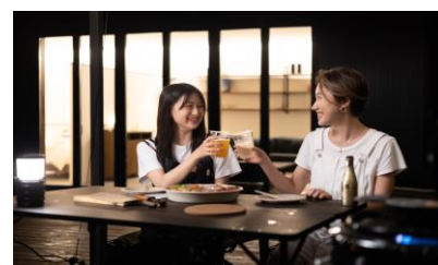
高原で極上のひと時を…