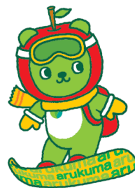
長野県PRキャラクター「アルクマ」 ©長野県アルクマ