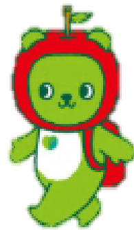
長野県PRキャラクター「アルクマ」