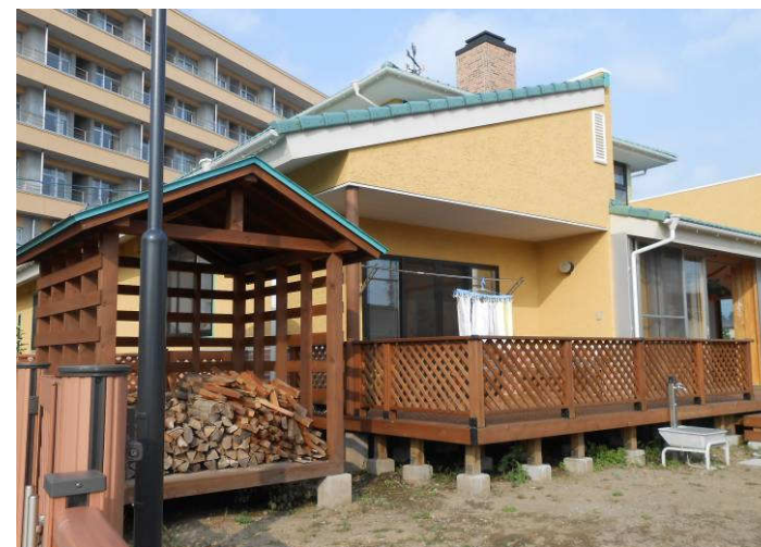
薪小屋(園庭に建築)