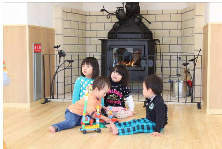
薪ストーブ(遊戯室に設置)