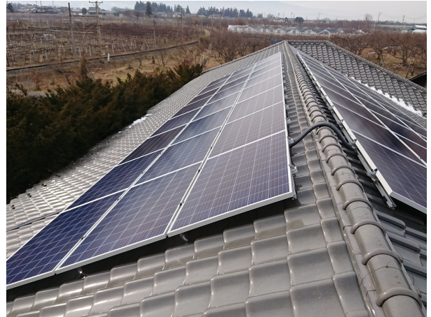
老人福祉センター桃源荘