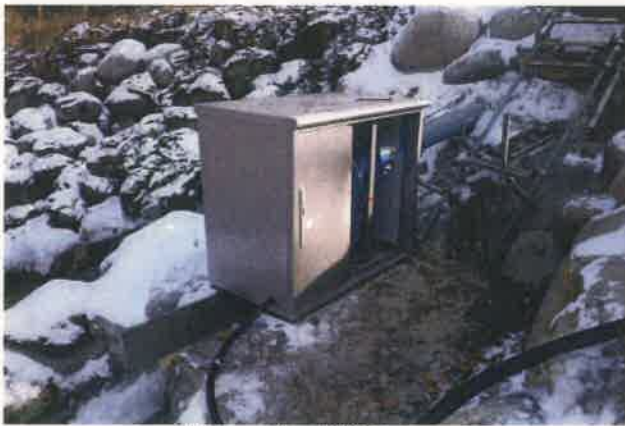
水車・発電機施工