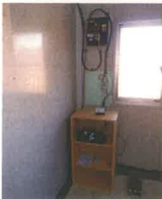
水車・発電機制御システム