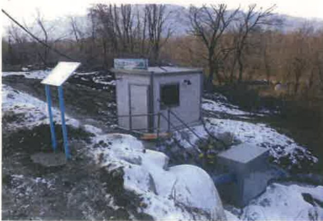
電気制御・管理室