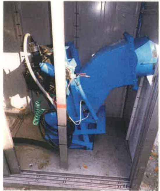
クロスフロー水車・発電機 (上部)