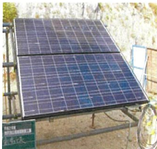
写真-1 (太陽電池アレイ)

必要な太陽電池の出力は、消費電力、使用時間、1日あたり日照時間の年平均、補正係数を基に次式により求めます。