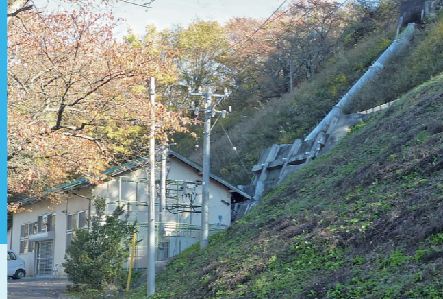
発電所建屋と水圧管路