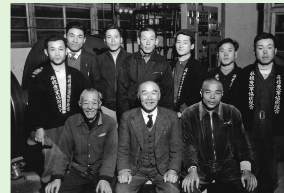
森泉村長と発電所職員

村民総動員で困難を乗り越えた結果、1955(昭和30)年9月、平根発電所は待望の本格運転を開始したのです。