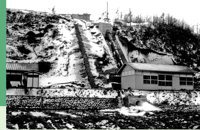
完成直後の発電所