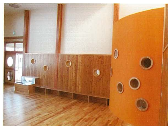
デン 園児の遊び心を刺激する隠れ家的空間「デン」を初めて設置しました。

年間を通じて安定した地中の熱エネルギーを取り出し、冷暖房に活用するシステムを須坂市で初めて導入しました。CO2 排出量の抑制と電気料等の削減が見込まれ、環境に配慮した施設として注目されます。