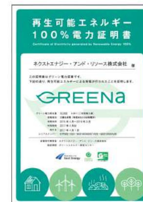
グリーン電力証書

グリーン電力証書の発行による「GREENa RE100プラン」は、毎月使用される電力量にグリーン電力証書を発行して「100%自然エネルギー」を証明します。グリーン電力証書は、長野県の太陽光や大分県の地熱など、当社と提携している日本全国11ヶ所(2020年1月1日現在)のグリーン電力発電所から発行されます。そして、皆さんの電気料金の一部はグリーン電力発電所に送られ、その設備の維持・管理に役立ち、自然エネルギーの普及につながっています。