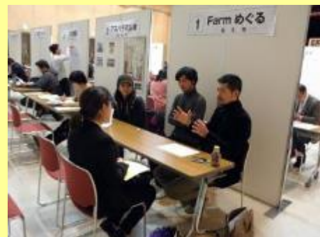
【就職希望者が農業経営体のブースを訪問】

県内の農業法人や農家が合計36ブースで、県内外からの72名の参加者に対して就業条件や将来のキャリアアップなどの説明をし、就職希望者に対する積極的な採用活動を行いました。