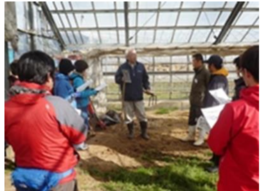
【就農体験研修の実施】