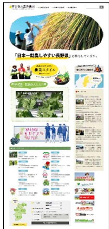
【デジタル農活信州】