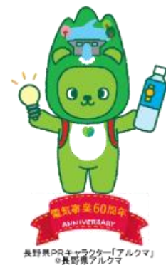
長野県PRキャラクター「アルクマ」