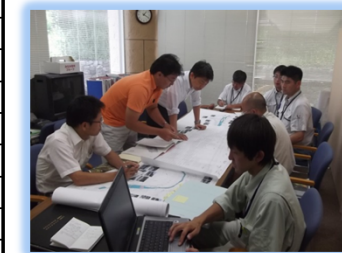
自然共生センター へ技術相談