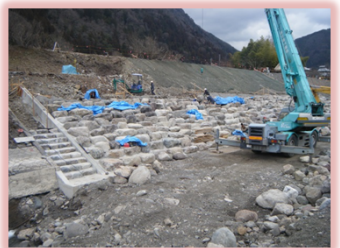
かぐら大橋上 右岸工事(施工中)