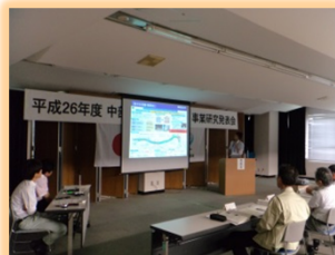
中部地方整備局 管内事業発表会 事例発表(優秀賞を獲得)