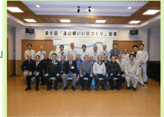
「遠山郷いい川づくり」 基本計画の決定