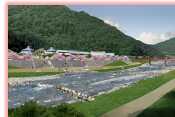
道の駅「遠山郷」周辺 完成イメージ