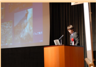
天竜川シンポジウム 事例発表