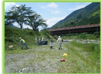
「遠山郷いい川づくり」 推進会議 河川愛護活動を実施