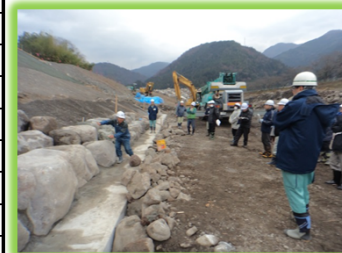
「遠山郷いい川づくり」 推進会議 現地見学会を開催