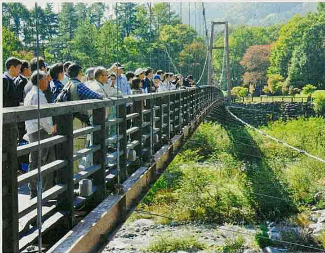
太田切川のコまくさ橋から、床固工群の現場を見学する参加者