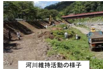
河川維持活動の様子

また、活動団体の高齢化等により人力不足となる作業や、重機を使用しないと困難な作業については、「わがまちの川」美化事業により、地元建設会社と協力して作業を行っています。