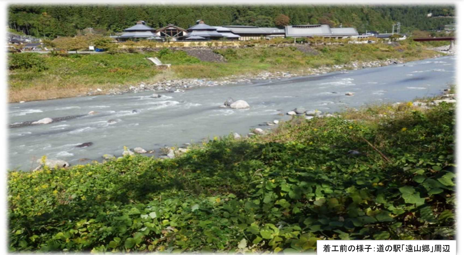
着工前の様子:道の駅「遠山郷」周辺