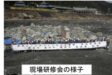
現場研修会の様子

川づくりの目標を推進するための活動を行う組織として、H25.10.24に地域の代表者の方々と結成されました。委員22名、オブザーバー5名で構成され、年間活動計画を策定し、実施→評価→改善を行い、次年度の活動へ活かす取り組みを行っています。具体的な活動としては現場研修会、河川維持活動、モニタリング調査等を行っています。