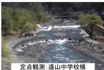
定点観測:遠山中学校横

遠山川においては、H27年度より地域住民と協働で、定点観測等のモニタリング調査を実施しています。