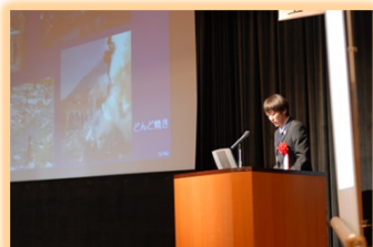
天竜川シンポジウム 事例発表