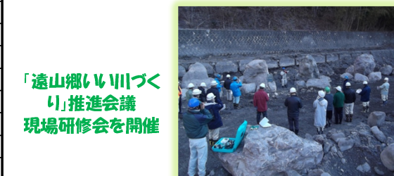
「遠山郷いい川づくり」推進会議 現場研修会を開催