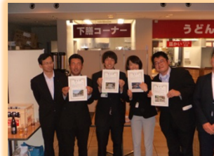
「関東のいい川づくり」選定委員会 事例発表(総合順位2位を獲得)