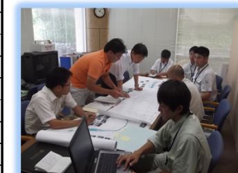
自然共生センターへ技術相談