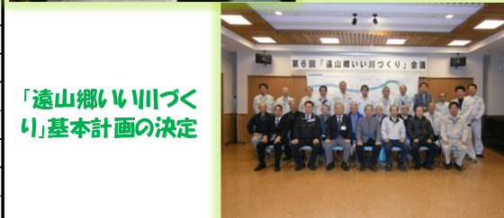
「遠山郷いい川づくり」基本計画の決定