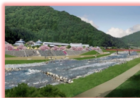
道の駅「遠山郷」周辺 完成イメージ