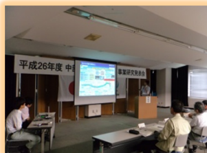
中部地方整備局 管内事業発表会 事例発表(優秀賞を獲得)