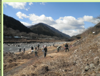
「遠山郷いい川づくり」推進会議