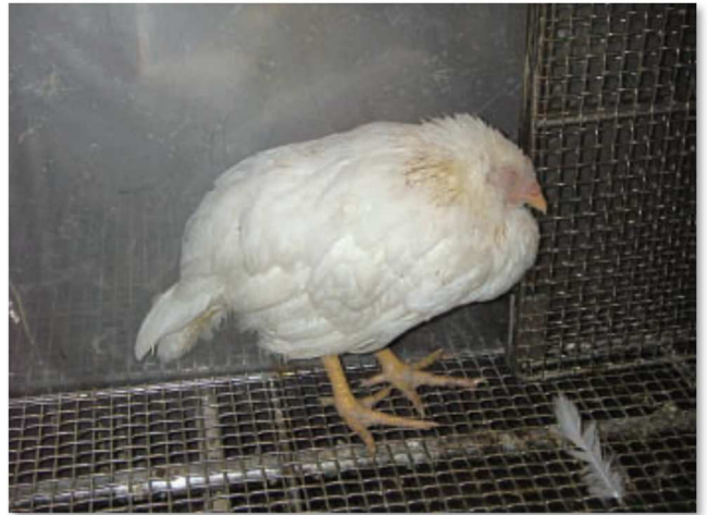
高病原性鳥インフルエンザウイルスに感染し、元気をなくしている鶏

➤ 鶏に元気がない場合やほぼ同時期に複数羽が死ぬ場合は、すぐに獣医さん（家畜保健衛生所、動物病院）に相談して、治療や指示などを受けましょう。