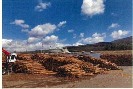
木質バイオマス発電施設【塩尻市】