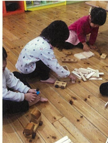
長野市 ひかりほいくえん