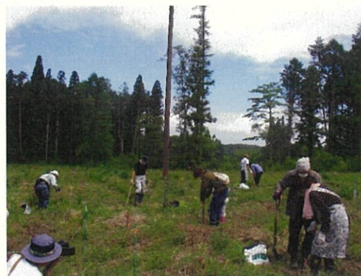
信濃町 柏原上野原