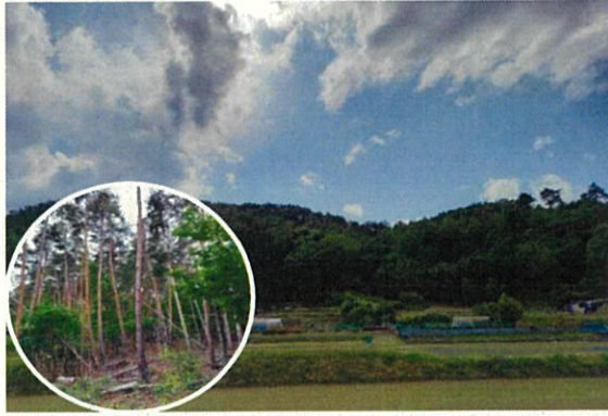
坂城町 上平地区 (松くい虫被害森林)