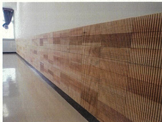
長野合同庁舎5階会議室