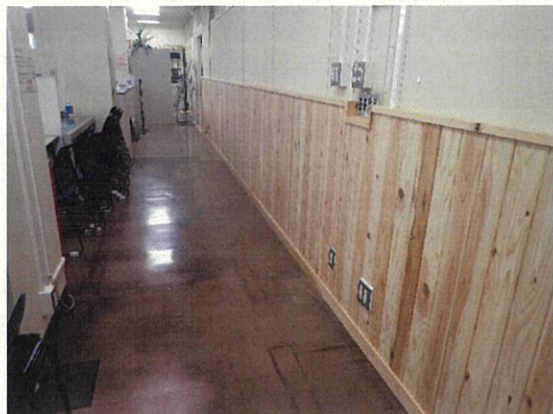
総合県税事務所壁面