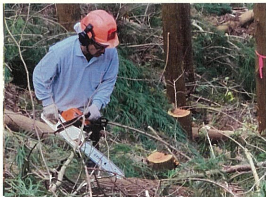
保育間伐（千曲市 森）